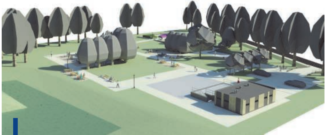
Wizualizacja terenu po byłym basenie. Po prawej ul. 1-go Maja. Rys. Artside Architekci