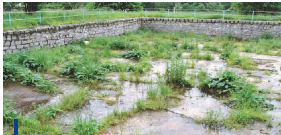
Teren basenu przed przebudową.