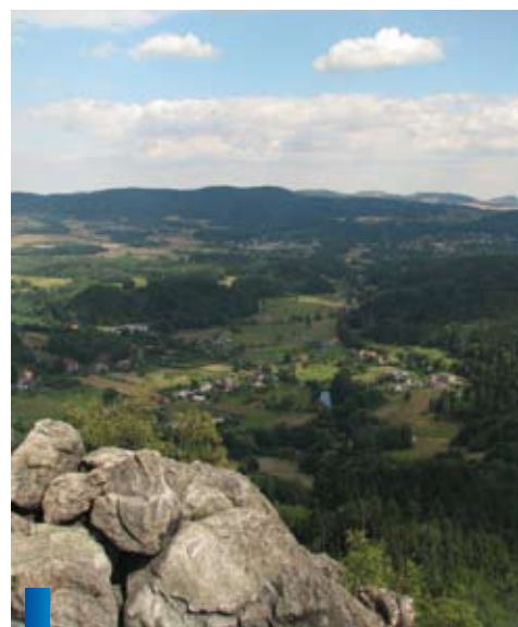
Fotografowanie zakątków gminy to nie tylko przyjemność, ale również szansa na nagrody