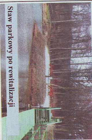
Staw parkowy po rewitalizacji