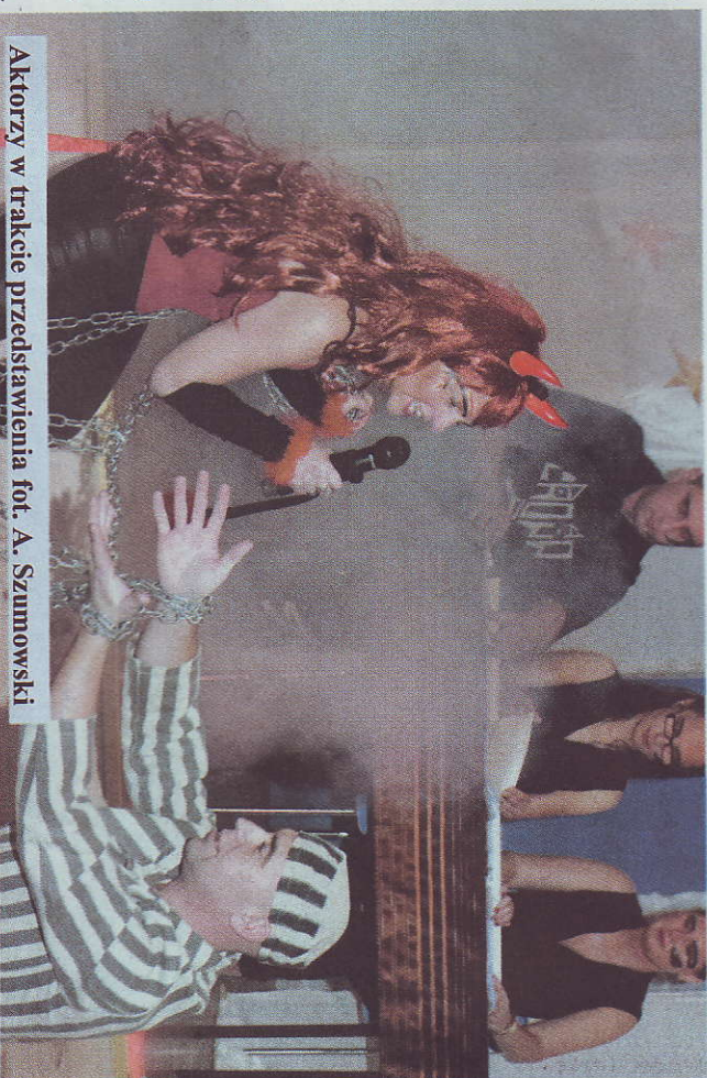
Aktorzy w trakcie przedstawienia