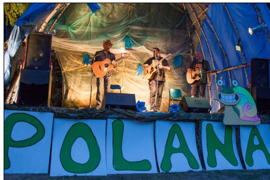
"Super Trio" czyli wyjątkowy zespół okazjonalny