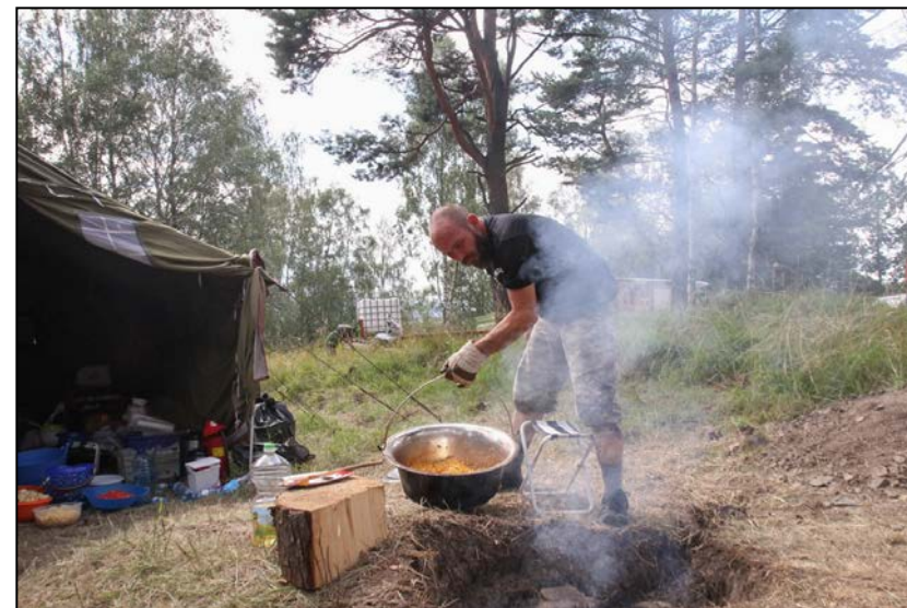
Szeff w swojej kuchni