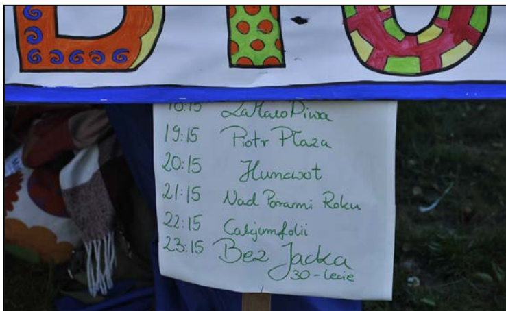
Program koncertów ustalony!