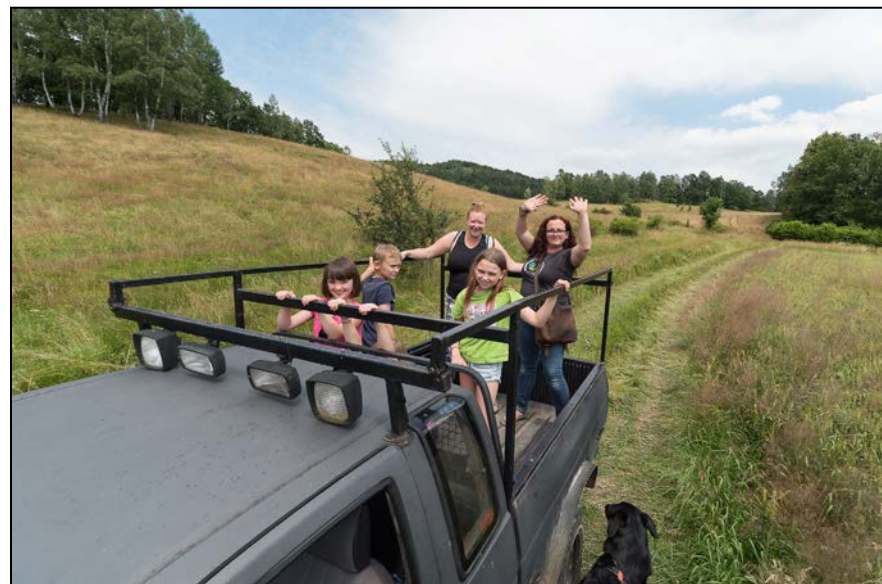
Wyjeżdżamy z naszej polanki