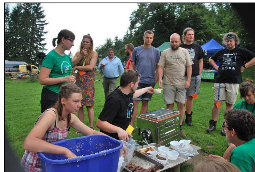
Czas na obiad. Polowa kuchnia polanowa

https://www.youtube.com/watch?v=Knwh3m3nhXU