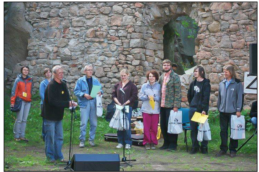
Laureaci pierwszego przeglądu