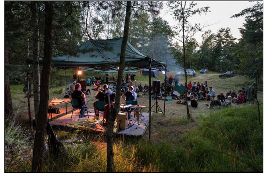
Spotkanie na Polanie tym razem w wyjątkowych okolicznościach