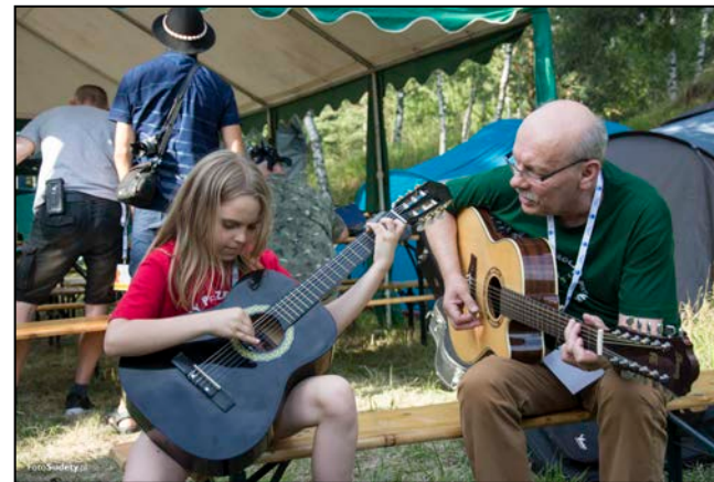
Mistrz i uczennica