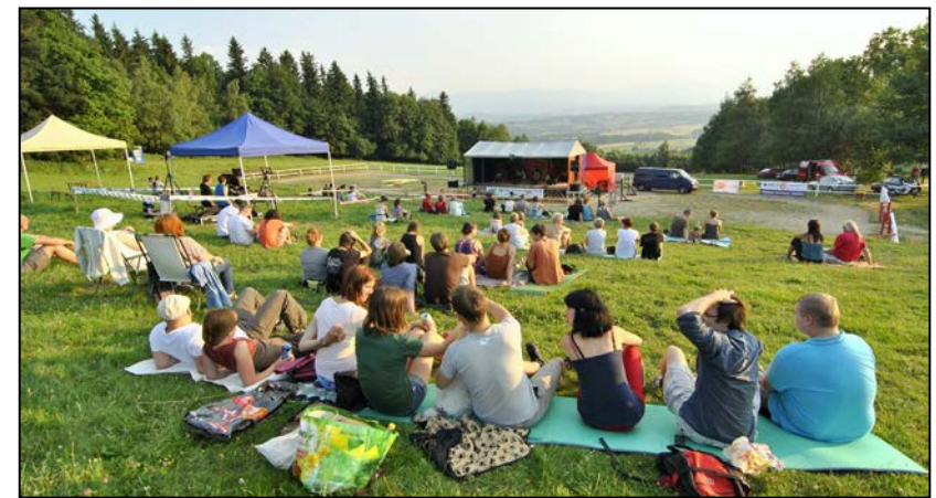
Widzowie, scena i widok na Karkonosze