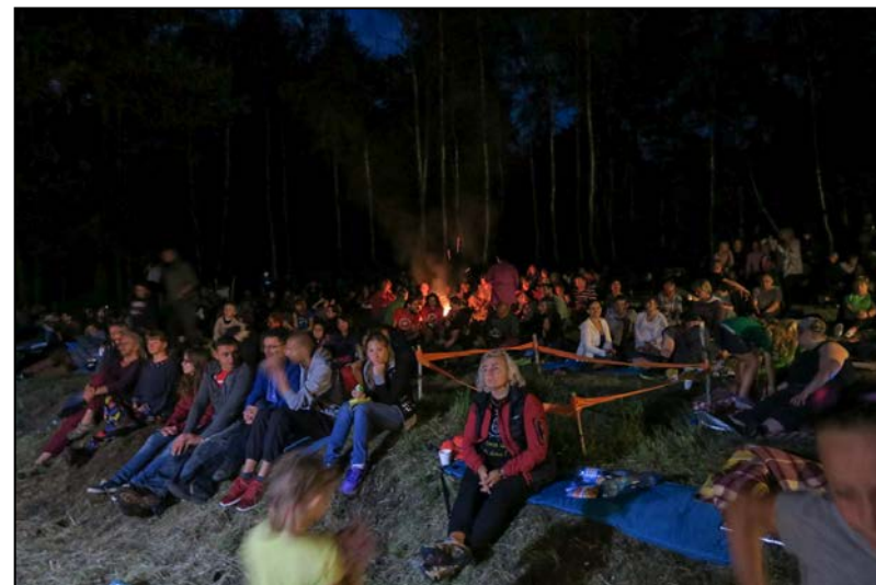
Wieczne koncerty w niezwykłym klimacie