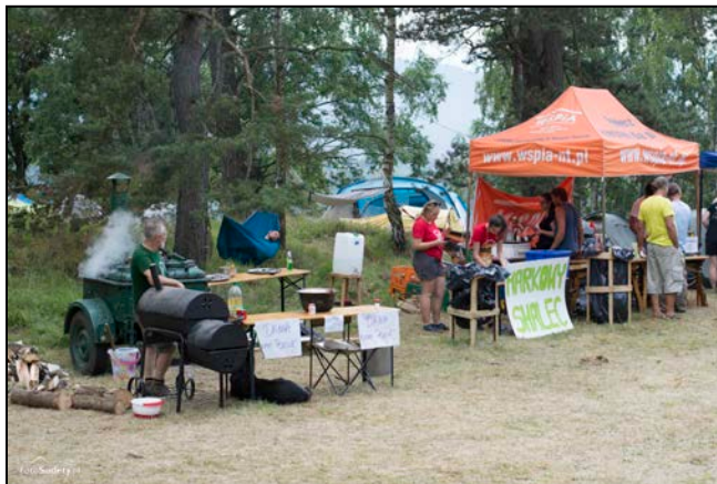
Polowa kuchnia, markowy smalec czyli kącik gastronomiczny

Każdego roku można było wywieźć z Polany rozmaite pamiątki z logo imprezy - zielono-niebieską gitarą: koszulki, kubki, buffy, torby bawełniane, piernikowe misie z gitarkami, piórka do gitary, kolczyki z piórek gitarowych, bransoletki z piórkami, mydełka z zatopionym logo, mydełka z odlewanym logo, breloczki, zakładki do książki, świeczniki, drewniane serca. Część z nich to rękodzieła wytwarzane, przez naszych Przyjaciół, Wolontariuszy i zaprzyjaźnioną Galerę Tao z Zakopanego.