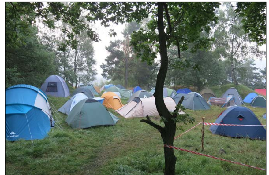
Miejsce odpoczynku - nasze pole namiotowe