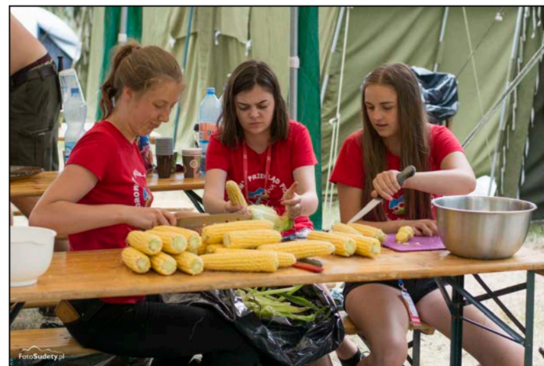
Prace kuchenne - szykujemy polanowe smakołyki