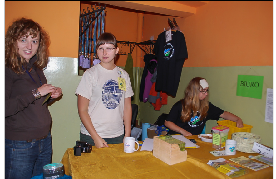
Biuro przeglądu działa sprawnie zawsze i w każdych warunkach