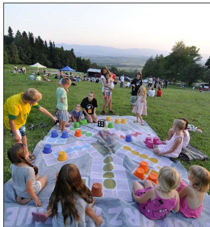
Chińczyk w wersji maxi = świetna zabawa dla maluchów