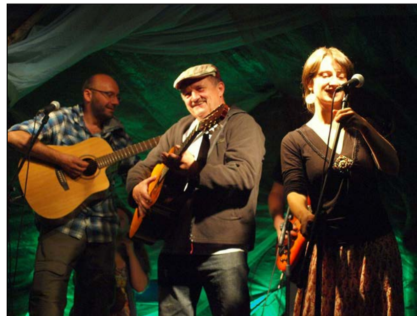
Jubilaci na scenie z niespodziewanym gościem koncert Na Bani