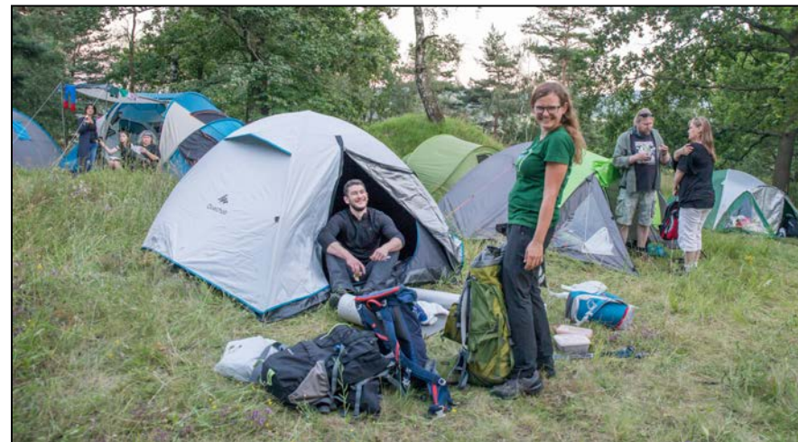
Na polu namiotowym humory też dopisywały