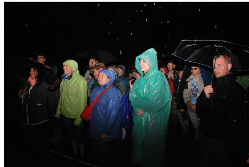
Polanowa publiczność nie boi się deszczu