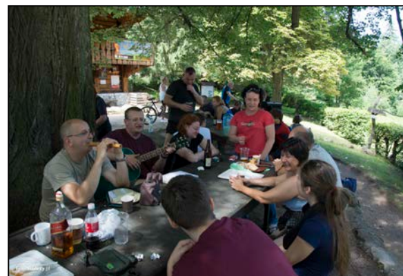
Szajcarkowa lipa sprzyja integracji