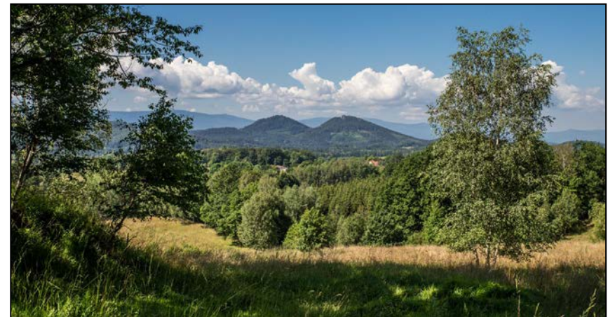
Sokolik i Krzyżna Góra - wierni towarzysze Polany