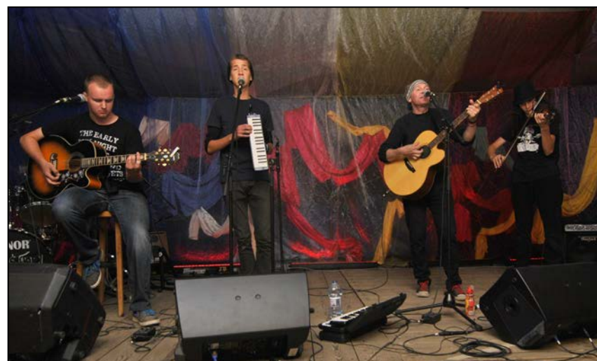
Nad Porami Roku na Polanowej scenie