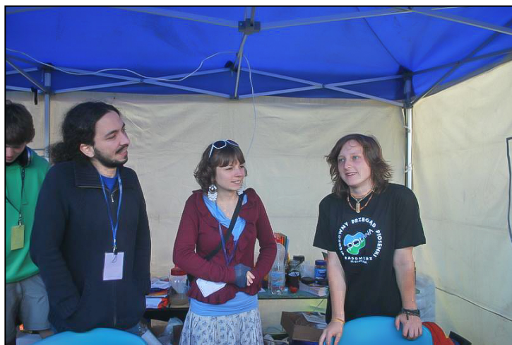
Muzyka łączy, nie tylko na scenie