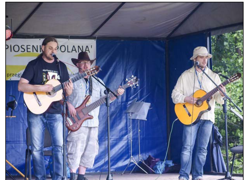
Zespół „Złocista Polana” wyśpiewuje właśnie pierwszą nagrodę