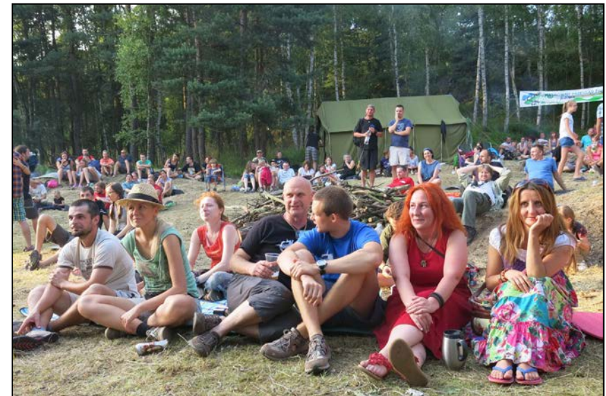
Polanowe "zastłuchanie" i "zapatrzenie"