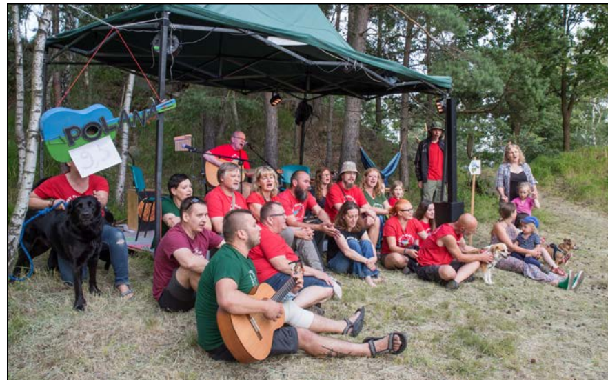
Polanowa Ekipa rozpoczęła sobotnie Spotkanie Polanowych Przyjaciół odśpiewaniem „Polanki”

https://www.youtube.com/watch?v=e-HaoZ62G9I