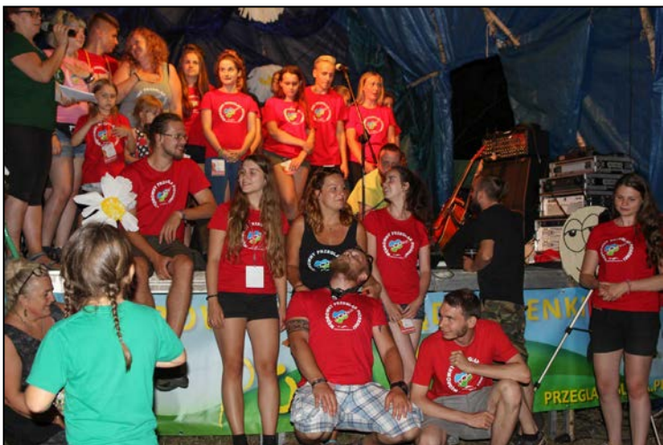
Młodzież "Polanowa" i jej pięć minut na scenie