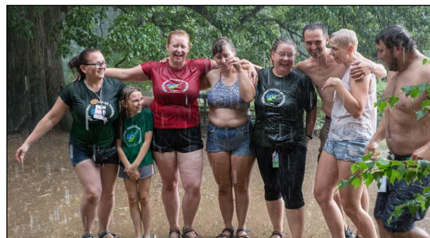
Za Polaną często płacze nawet niebo