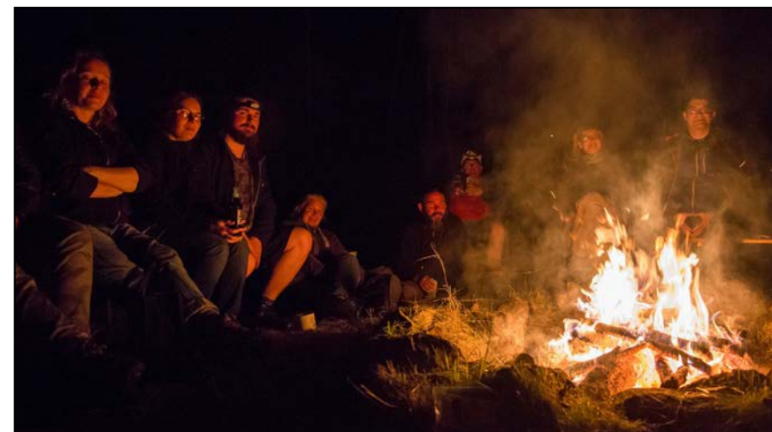
Polanowe ognisko zapłonęło i tym razem