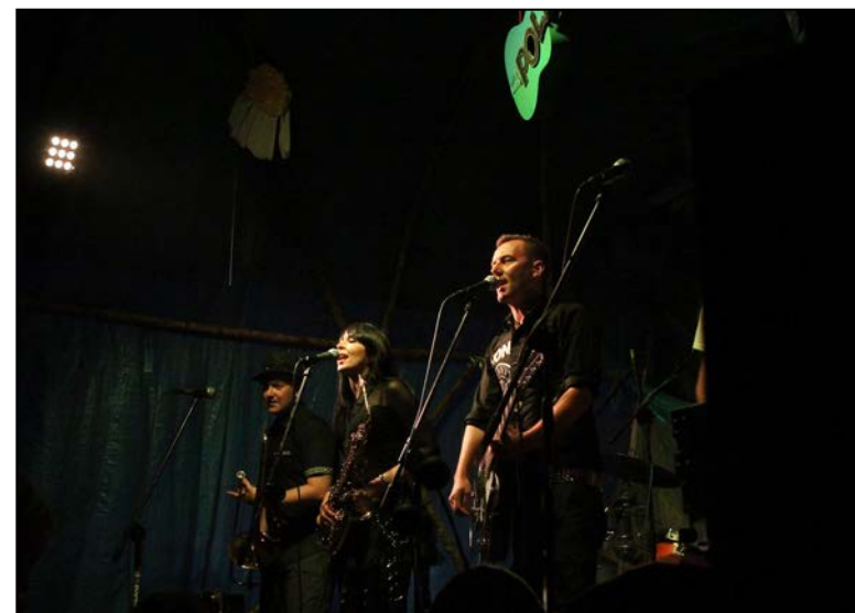
Leniwiec przyciągnął na Polanę nie tylko fanów Krainy Łagodności