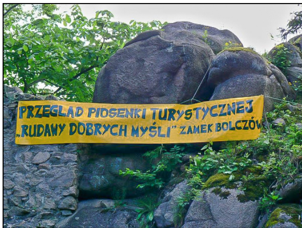
Historyczny baner wykonany własnoręcznie przez świetlicową młodzież, powieszony przez zaprzyjaźnionych wspinaczy

Przeгляд Piosenki Turystycznej “Rudawy Dobrych Myśli” formalnie wsparło Stowarzyszenie Mieszkańcy Gminie oraz świeżo powstała Fundacja Przystanek Dobrych Myśli, finansowo - Polska Fundacja Dzieci i Młodzieży. Logistycznie, poza naszą ekipą zachęciliśmy do współpracy i pomocy kilkoro mieszkańców naszej gminy, którzy wsparli nas sprzętem i środkami transportu. Przy rozwożeniu sprzętów po imprezie do pomocy dołączyło kilkoro widzów.