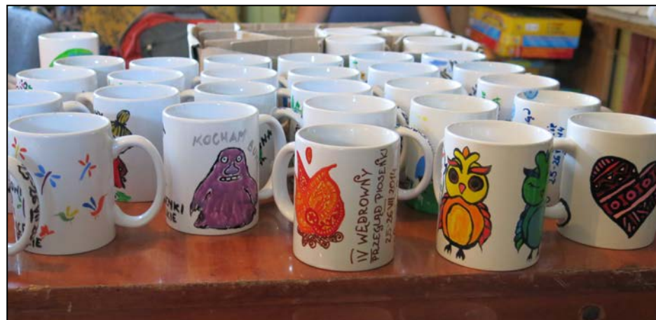
Polanowe kubki z roku na rok zyskiwały na niepowtarzalności