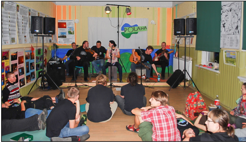
Próba dźwięku przed kolejnym występem