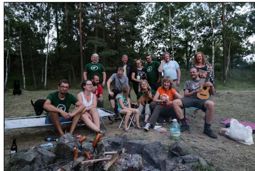
Po ciężkiej pracy przysła pora na odpoczynek

Film Przyjaciółki Polany - Ali: https://www.youtube.com/watch?v=3pk-9lgUkpA