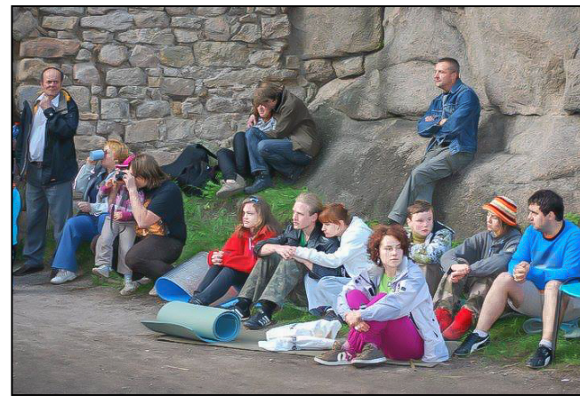
Jak na charakter przeglądu przystało warunki były bardzo turystyczne