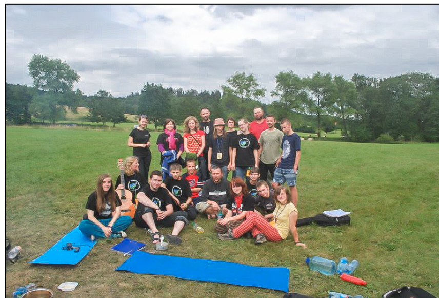
Tak, to my! Organizatorzy i Przyjaciele Polany 2011