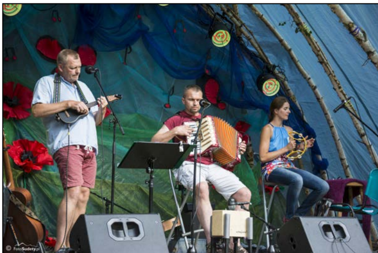
Po raz drugi na Polanie Grupa Zagrali i Poszli