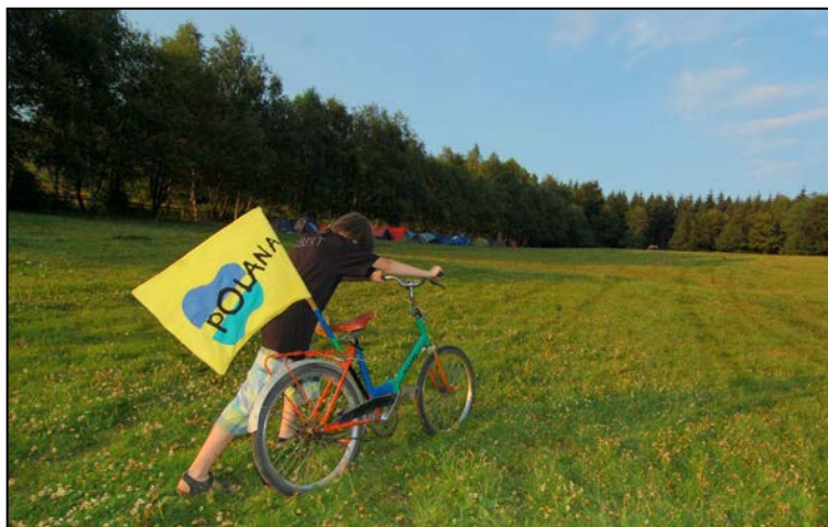
Najmłodszy wolontariusz i polanowy (zaginiony niestety) rowerek

Trzon polanowej ekipy stanowiła nadal janowicka młodzież i kilkoro jej rówieśników. Nie brakowało pomysłów, kreatywnych rozwiązań, chociaż często zmęczenie dawało się mocno we znaki. Organizatorów wspierali wolontariusze, którzy dotarli do nas z różnych regionów kraju.