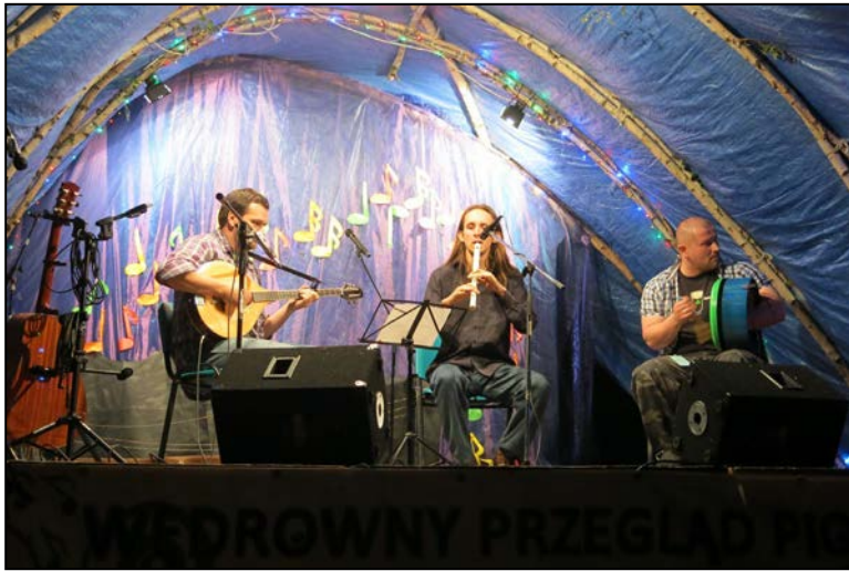
Celtyckie klimaty czyli zespół Celtic Tree