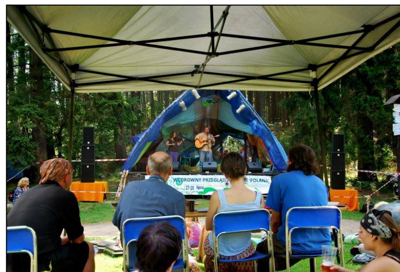
Jury zasłuchane w brzmienie jednego z konkursowych wykonawców