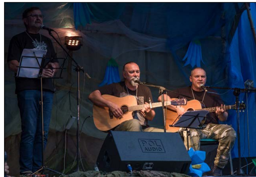
Zespół "Bez idola" w wieczornej, polanowej scenerii