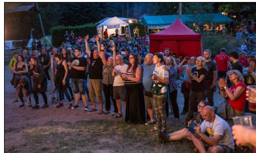
Takich cudownych widzów mamy!