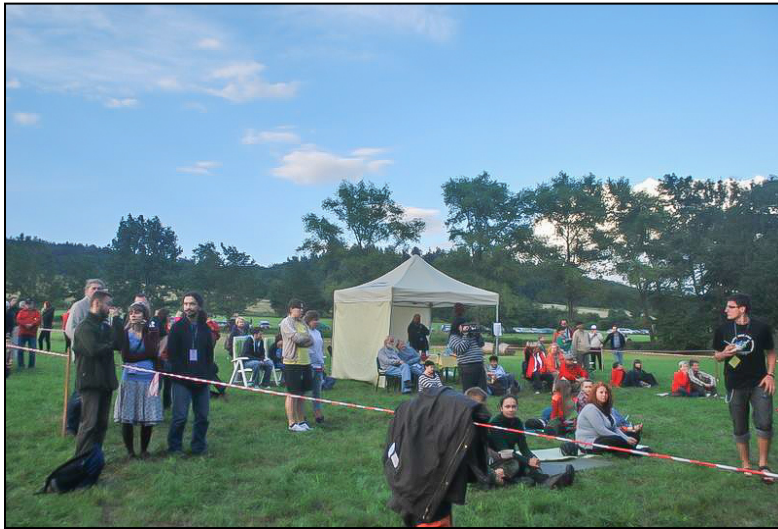
Po deszczu znów można się spotkać na polanie