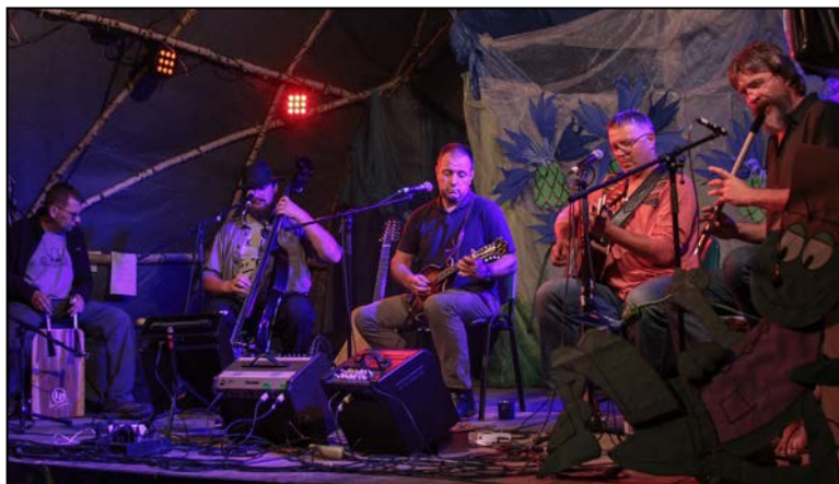
Formacja i ich koncert na Polanie