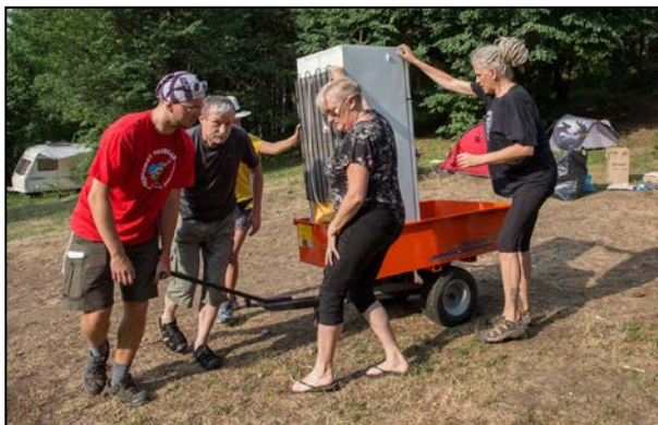
Ciężka jest praca wolontariusza

Wszystkim, którzy przez tę dekadę wsparli „Polanę” ogromnie dziękujemy!