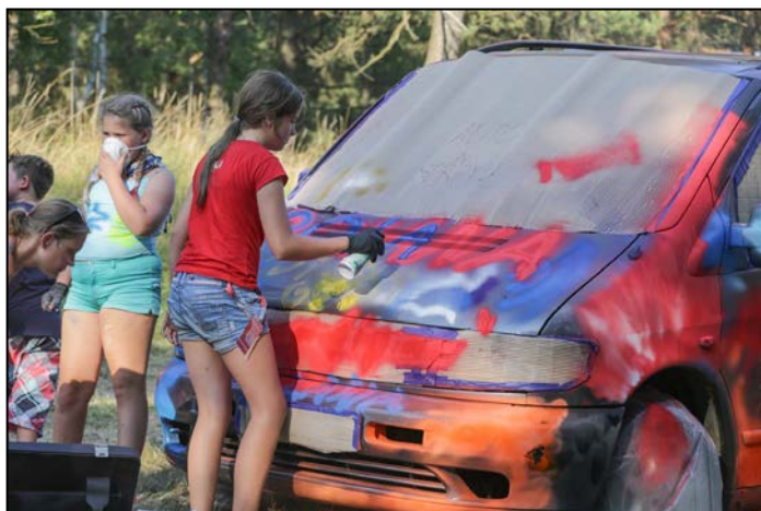
Auto zmienia swoje oblicze