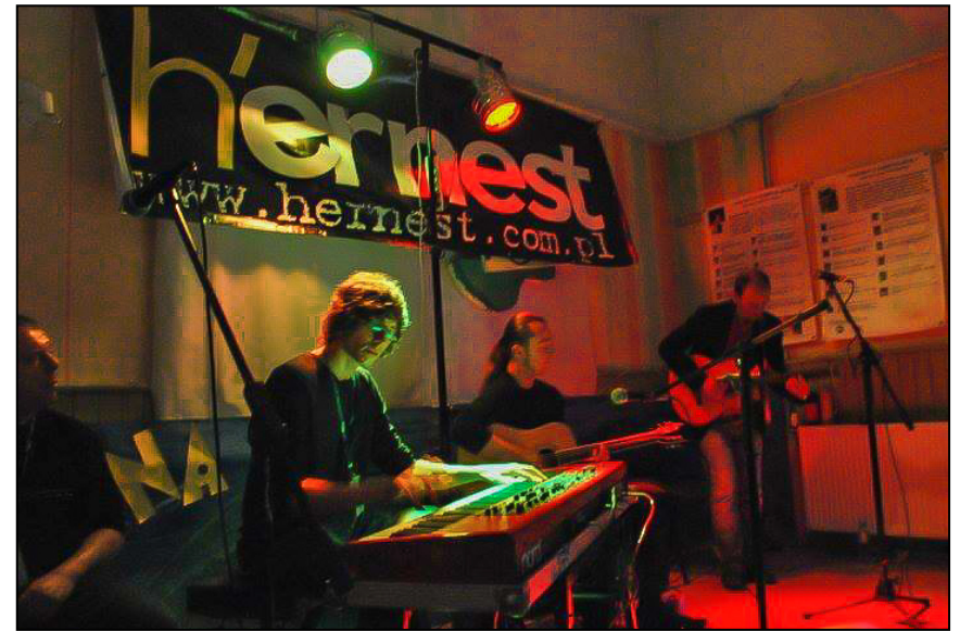
Klimat Polany wciąż zachowany