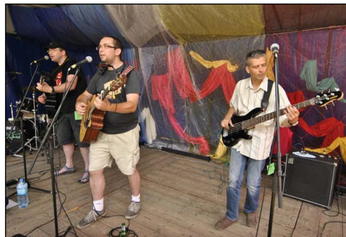
Jednym z wykonawców był zespół ZaMałoPiwa.