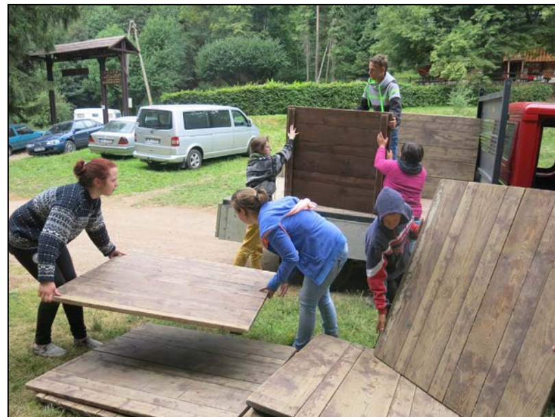
Kolejne elementy układanki