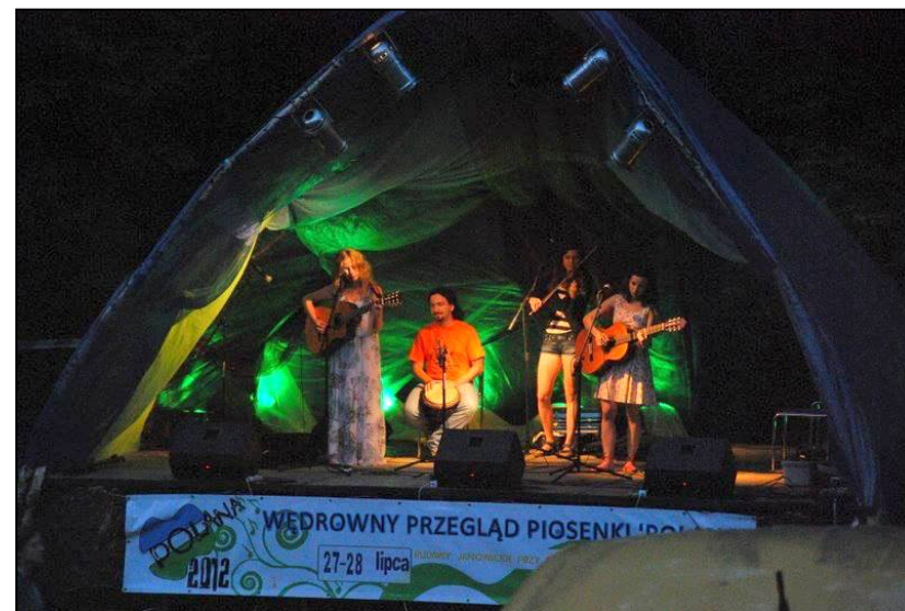
Zespół Myśli Rozzochrane Wiatrem Zapisane po raz drugi wystąpił na Polanie