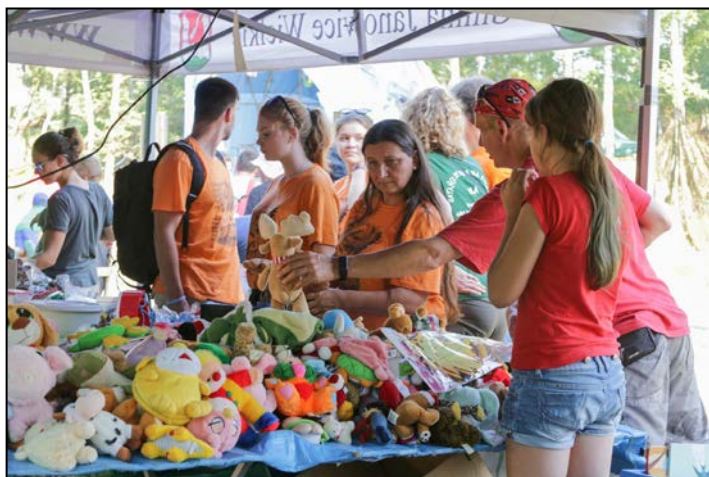
Loteria fantowa - tu każdy znajdzie coś dla siebie