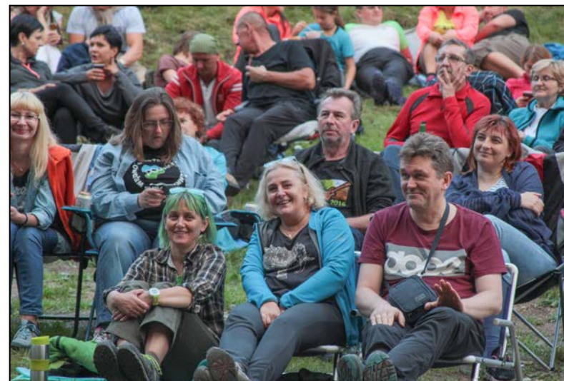
Polanowi widzowie po latach siedzenia na karimatach dorobili się krzesłek