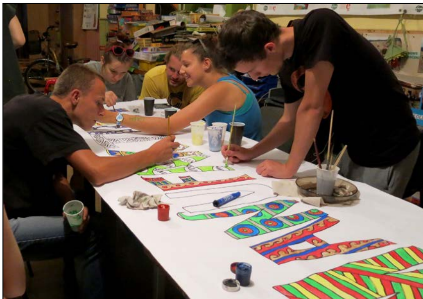
Wolontariusze przeglądu mają również zdolności artystyczne