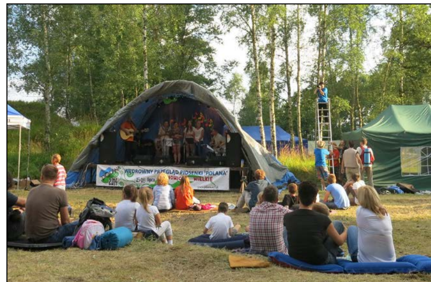
Mistrz drugiego planu czyli polanowa scena, publiczność i ... fotograf na drabinie