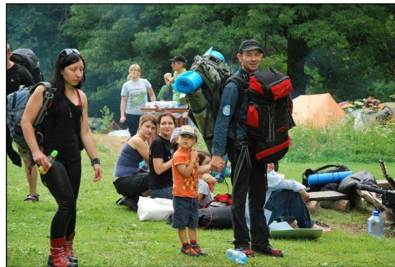
Polana to miejsca dla małych i dużych!