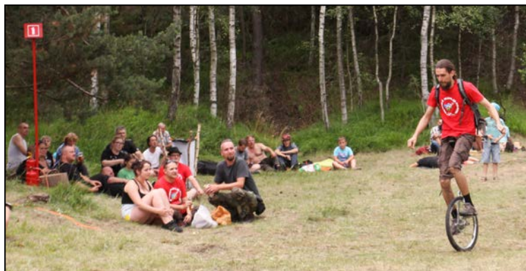
Mosiu na monocyklu czyli wolontariusz w akcji