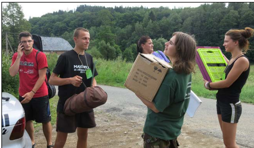
Wolontariat wymaga zaangażowania. Nasi młodzi pomocnicy ciężko pracują