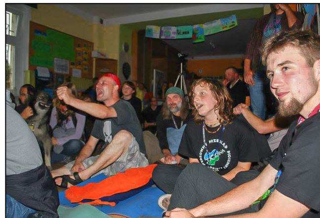
Publiczność zawsze z nami!