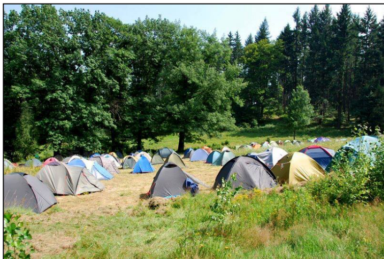
Polanowe pole namiotowe w pięknych okolicznościach przyrody