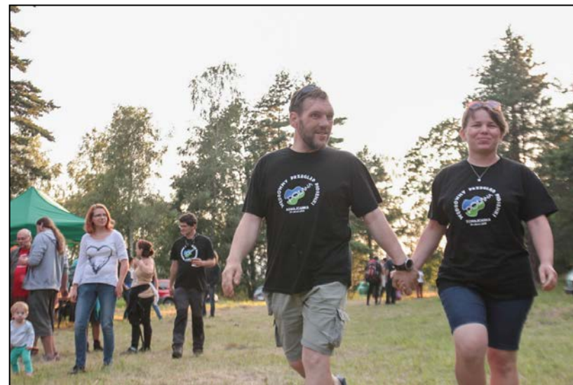
Aga i Tedi przyjeżdżają do nas od lat

https://www.youtube.com/watch?v=ti8QdMKL5IA