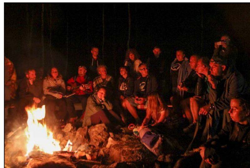
Polanowe śpiewanki przy ognisku na stałe wpisały się w repertuar przeglądu