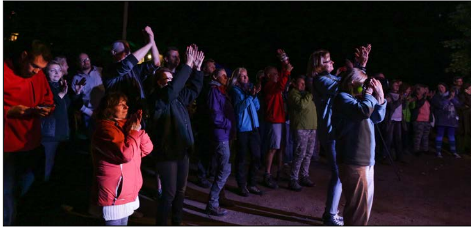
Emocje podczas koncertów pod sceną