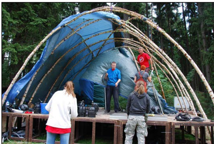
Brzozowa scena w budowie. Jest jednym z wyróżników Polany