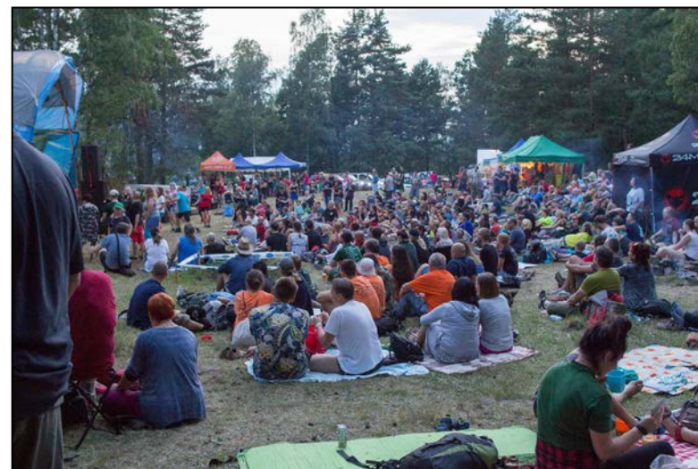
Tłumy na Polanie