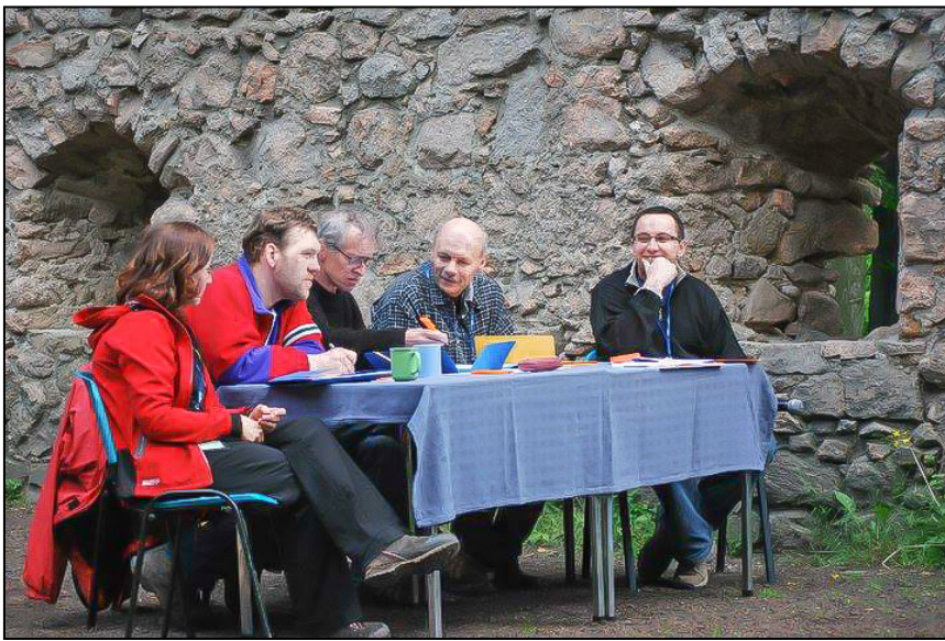
Trudne dylematy szacownego jury. Czy pełne dobrych myśli?