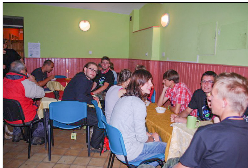
W kularach też wiele się działo! Nasi wolontariusze odpoczywają po pracy

https://www.youtube.com/watch?v=mR41hsfBMz0