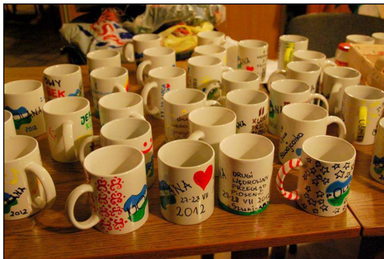
Polanowe kubki - malowane sercem i pasją

Z drugą "Polaną" zawitaliśmy do schroniska "Szwajcarka". Nie przewidywaliśmy wtedy, że wrócimy w to miejsce jeszcze niejedną raz... Przekroczyliśmy w ten sposób administracyjne granice gminy Janowice Wielkie, ale pozostaliśmy w górskich klimatach, w naszych ukochanych Rudawach Janowickich. Dzięki organizacji imprezy przy schronisku zyskaliśmy dostęp do prozaicznych, ale jakże ważnych udogodnień jak prąd czy bieżąca woda. Szukaliśmy pomysłu na oryginalną scenę i zdecydowaliśmy się wykonać zadanie sceny we własnym zakresie. Konstrukcja została wykonana z cienkich, brzożowych pni i stała się naszym znakiem rozpoznawczym przez kolejne lata. Tym razem pogoda była dla nas nieco łaskawsza niż podczas pierwszej Polany, ale po pierwszym, upalnym dniu, następnego dnia podczas koncertów dotarła do nas burza. Nie przeszkadzało to jednak ani muzykom, ani widzom, którzy z parasolami i w płaszczach przeciwdeszczowych w ulewie stali pod sceną i śpiewali razem z wykonawcami. A po występach już tradycyjnie na wszystkich czekało ognisko i wspólne muzykowanie. II "Polanę" zorganizowała ekipa młodzieży z pomocą kilku bardziej doświadczonych osób z Fundacji Przystanek Dobrych Myśli. Po raz pierwszy na przeglądzie zawitała oficjalna grupa wolontariuszy.