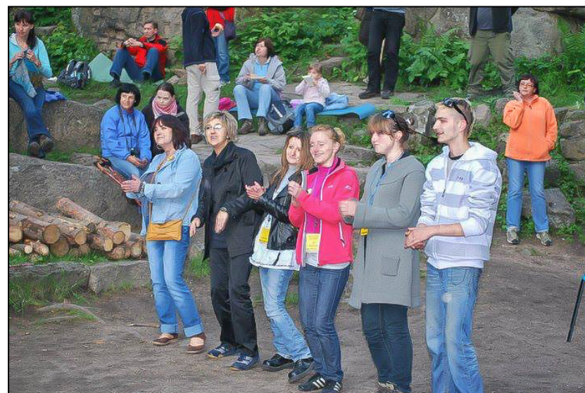
Dobra zabawa w dobrym klimacie