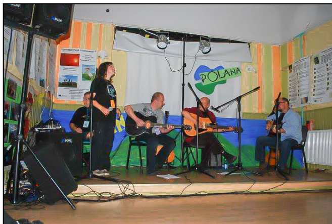
Deszcz nam nie straszny czyli festiwal w janowickiej świetlicy

Na przeszkodzie stanęła ... pogoda. W tygodniu "polanowym" przez pięć dni padało. W strugach wody rozkładaliśmy scenę i przygotowaliśmy miejsce na imprezę. Deszcz nie odpuszczał i pierwszego dnia podjęliśmy decyzję o przeniesieniu "Polany" do pomieszczeń świetlicy wiejskiej "Rudawy" w Janowicach Wielkich. Koncerty odbyły się w trudnych warunkach, ale przy pełnej sali. Pogodna noc sprawiła, że znaleźli się nawet chętni na ognisko. Drugi dzień koncertów odbył się już w plenerze. Ognisko po Polanie paliło się jeszcze przez kilka dni, gromadząc wokół organizatorów i wolontariuszy.