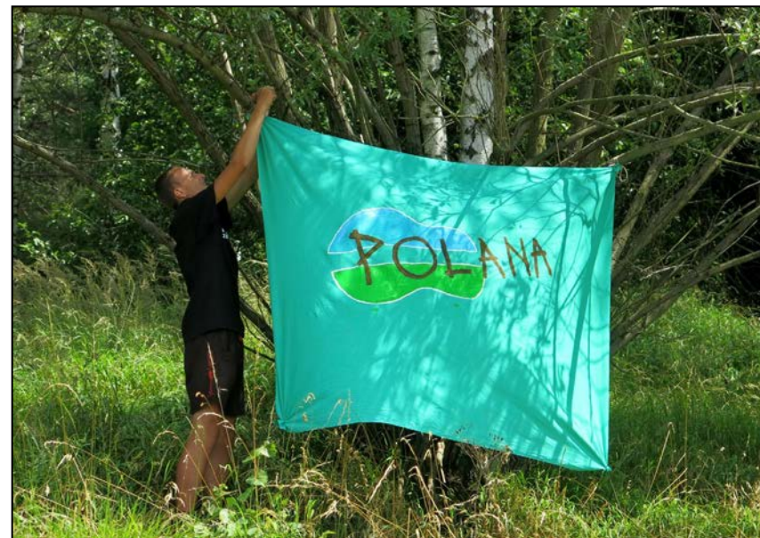
Logo Polany zawsze wita naszych gości