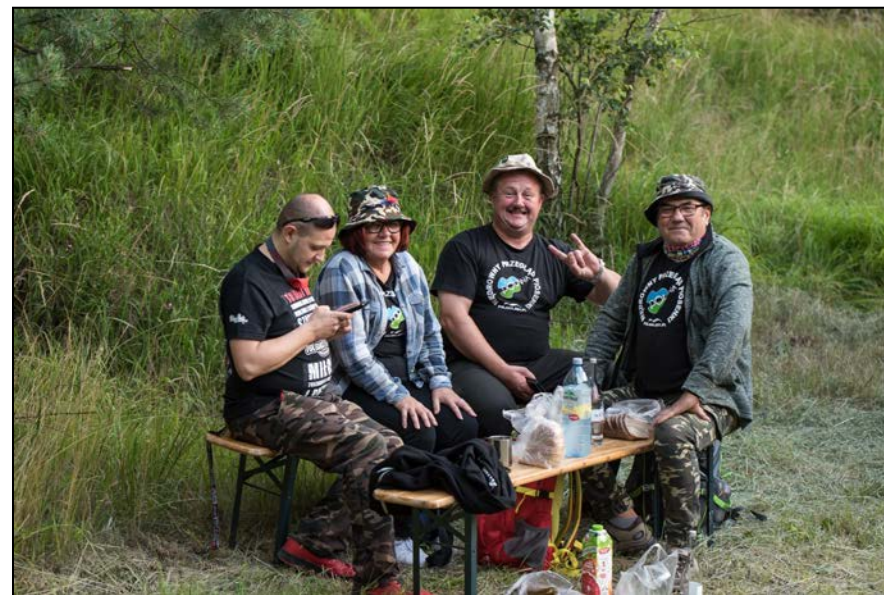
Polanowi Przyjaciele z różnych zakątków Polski