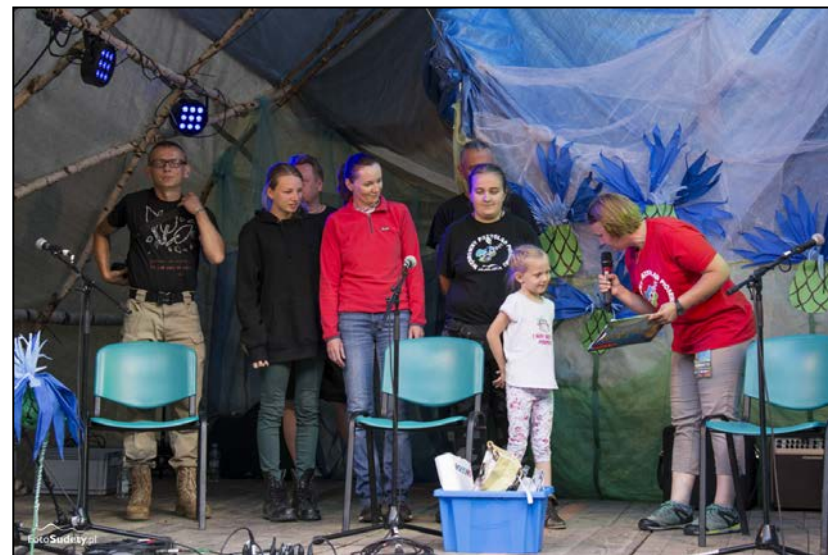
Mali i więksi laureaci Konkursu Poetyckiego "O kwiat Polany"