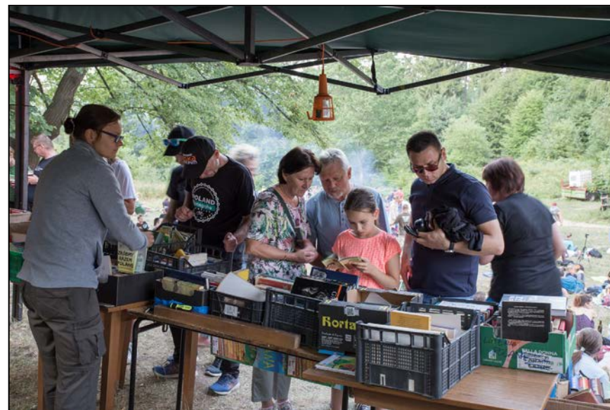
Sporo osób wyjechało z książką z Polany