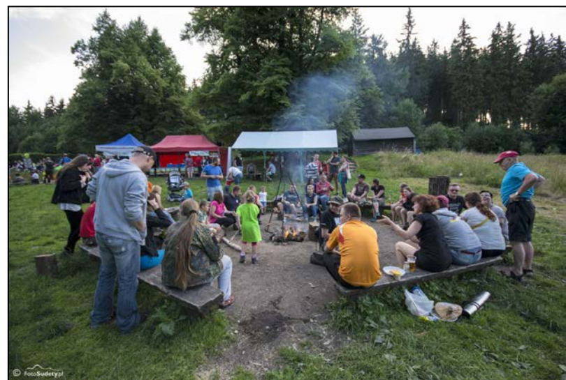
"After party" czyli nasze polanowe ognisko