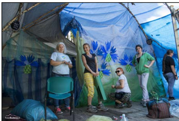
Zespół dekoratorek sceny w pełnej krasie

Natomiast my – organizatorzy przeglądu, wędrujemy ku niemu przez cały rok. Nasza podróż do kolejnej Polany zaczyna się na ogół we wrześniu, jest dość mozolna, pełna zawirowań, poszukiwań, pomyłek, błąkania się. Od czasu do czasu przeżywamy niepowodzenia, przegrywamy konkursy, przyjmujemy odmowy potencjalnych darczyńców, martwimy się, że mamy za mało chętnych do współpracy. Ale odnosimy też sukcesy w nowo podejmowanych wyzwaniach, mamy sprawdzone ścieżki, wiernych, trwających przy nas Przyjaciół, którzy wspierają nas w naszej drodze. Nigdy nie tracimy nadziei, nazwa Stowarzyszenie Góry Szalonych Możliwości zobowiązuje. Jak zwykle, pod koniec lipca docieramy do celu. Wędrowny Przegląd Piosenki „Polana” jest dowodem, że warto wyruszać w drogę w nieznaną. Że realizując marzenia można działać wbrew zdrowemu rozsądkowi, bez stałego wsparcia, ale z sercem na dłoni. Nasze kręte drogi i wyboiste ścieżki doprowadzają nas co roku do finału - muzycznych spotkań z serdecznymi, wrażliwymi ludźmi w plenerach Rudaw Janowickich i okolic.