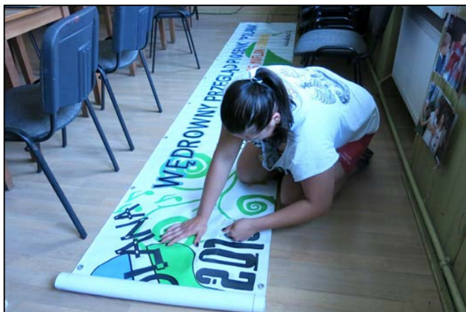
By coś się zaczęło musi coś się skończyć, czyli lifting polanowego banera

To był ostatni przegląd organizowany w dotychczasowym, młodzieżowym składzie. Młodzi, którzy od kilku lat tworzyli przeglądy piosenki, zaczęli wybierać różne drogi rozwoju, nauki, życia osobistego, część z nich wyjechała na studia, niektórzy założyli rodziny. Kończąc imprezę wiedzieliśmy już, że czekają nas duże zmiany, ale byliśmy też pełni nadziei, że nie stanie się nic złego, bo zmiany oznaczają coś nowego, a “nowe” to świeże podejście, oryginalne rozwiązania, kolejne doświadczenia, pomysły.