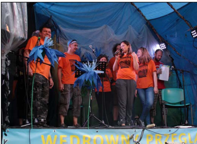
Ekipa giełdowa zaprasza na swój festiwal