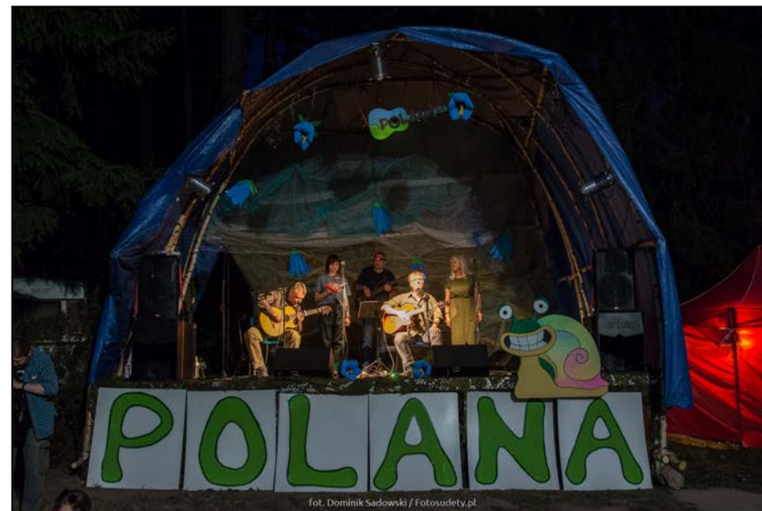
"Wszystkiego Najlepszego" na przeglądowej scenie

https://www.youtube.com/watch?v=IMPZonYquPE