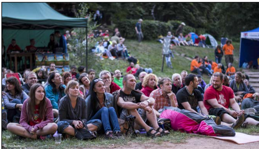
Niezawodna i wierna polanowa publiczność