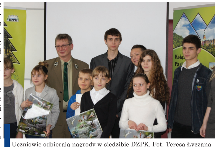
Uczniowie odbierają nagrody w siedzibie DZPK.