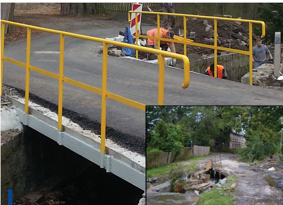
Naprawiona droga i most w Komarnie.