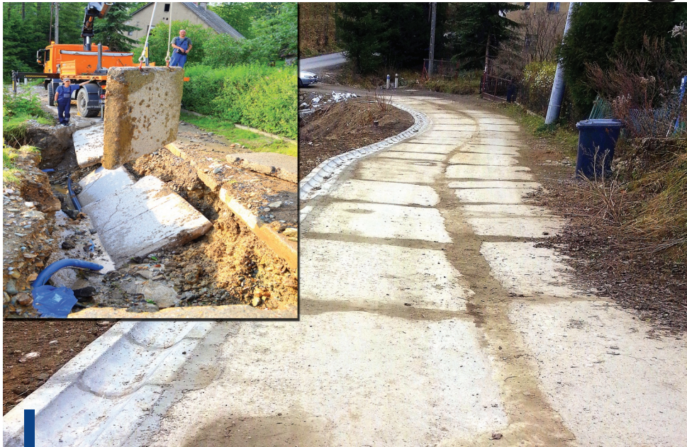
Odbudowana droga w Komarnie.

W postępowaniu przetargowym na zadanie w Komarnie wyłoniony został wykonawca (firma INKOBUD), który dokonał już wszystkich napraw i zakończył wszystkie prace. Większym problemem okazało się wyłonienie wykonawcy na zadania w Radomierzu i Trzcińsku, gdzie zakres prac był większy. Firma wyłoniona w przetargu odstąpiła od wykonania projektu, wnosząc o zaawansowane zmiany zarówno w projekcie jak i technologii wykonania. W przypadku Radomierza, gdzie zakres odbudowy jest bardzo szeroki, a terminy wykonania usługi były krótkie, zdecydowano się