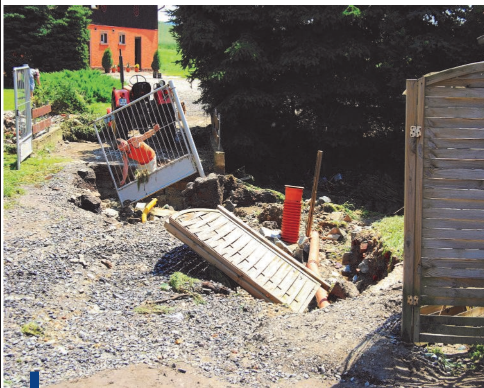
Wjazd na posesję w Komarnie