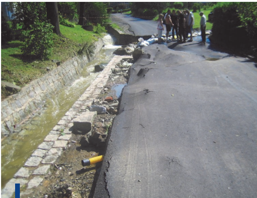
Droga powiatowa zniszczona przez potok Komar w Komarnie

W sytuacji zagrożenia z pomocą przyszła Ochotnicza Straż Pożarna, pracownicy Urzędu Gminy oraz sami mieszkańcy. Niestety, skala żywiołu, jego gwałtowność oraz siła zaskoczyły wszystkich. Dopiero po opadnięciu wody można było ujrzeć rozmiar strat, jakie ulewa wyrządziła. Zalane zostały posesje, woda wdarła się do mieszkań, niszcząc ich wyposażenie, uszkodzeniu uległ sprzęt i maszyny. Zniszczona została droga powiatowa w Komarnie, poważnie uszkodzona kanalizacja i wodociąg, rozmytych zostało wiele bocznych dróg, utrudniając tym samym dojazd do posesji. Ale nie tylko Komarno poniosło straty. Wezbrane wody Radomierki zalały również prywatne posesje w Radomierzu, uszkodzeniu uległa droga gminna oraz powiatowa, zniszczone zostały przepusty, mury oporowe. W Janowicach Wielkich poważne uszkodzenia wystąpiły głównie na drogach gminnych oraz w urządzeniach