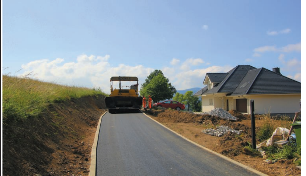
Odbudowa drogi w Radomierzu

Planowo przebiega odbudowa dróg na terenie naszej gminy. Ze środków otrzymanych na usuwanie skutków powodzi odbudowywana jest droga w Radomierzu. Inwestycję na kwotę 375 tys. realizuje COM-D z Jawora. Odbudowywany jest również mur oporowy przy drodze gminnej łączącej Trzciesko z Janowicami. Wykonawcą tej inwestycji jest Eko-Mel z Jeleniej Góry, a jej wartość opiewa na kwotę 325 tys. Kolejną inwestycją, która ma miejsce na terenie naszej gminy jest odbudowa drogi gminnej w Komarnie. Tam inwestycją zajmuje się JPRD z