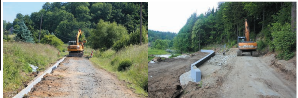
Odbudowa drogi w Komarnie oraz muru oporowego w Trzciesku