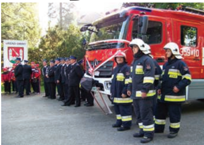
Janowiccy strażacy w gotowości bojowej

W sobotę 4 października Janowicka Ochotnicza Straż Pożarna z rąk Wójta Gminy Janowice Wielkie otrzymała akt przekazania i kluczyki do nowozakupionego samochodu ratowniczo-gaśniczego.