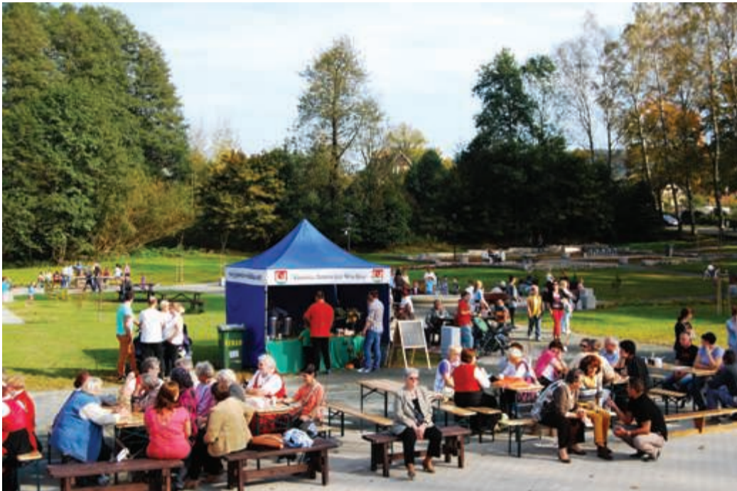
„Zielona Dolina” - teren rekreacyjny w miejscu dawnego basenu.

W sobotę 11 października przy pięknej pogodzie w miejscu zamkniętego od lat basenu letniego w Janowicach Wielkich otworzono nowy teren rekreacyjny.