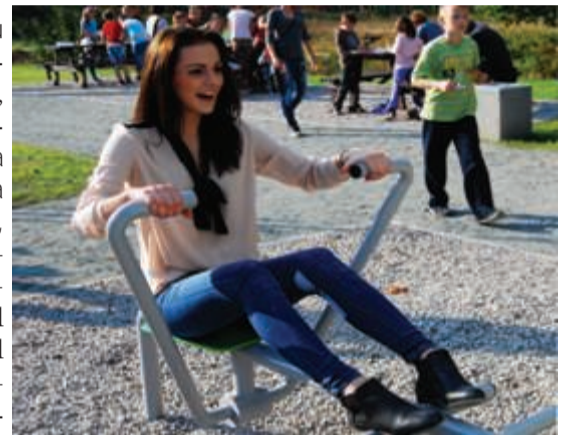
Miss Publiczności daje przykład

W tym miejscu będą odbywać się imprezy gminne, między innymi święto gminy-Janowianki. Zakończyły się również konsultacje co do nazwy obiektu - w drugim etapie konsultacji mieszkańcy wybierali nazwę parku spośród 19 zgłoszonych. Zwyciężyła