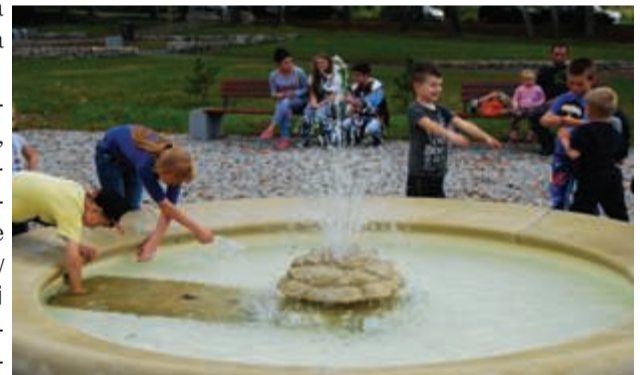
Doznanie przyjemności chłodu wody