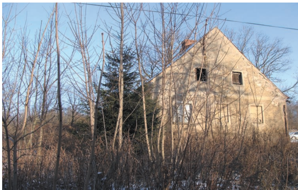
Jeden z opustoszałych budynków : w przyszłości może skansen

Coraz wyraźniej widać odradzanie się Miedzianki. Chociaż nie można jej odbudować jako miasteczka w dawnej postaci, to jednak staje się ważna jako cel wycieczek. Równocześnie dzięki zaangażowaniu przedstawicielstwa wsi pojawiają się urządzenia, które czynią zaniebaną Miedziankę znośniejszym miejscem do życia. Szansą dla Miedzianki będzie rewitalizacja, jaką chciałoby prowadzić Stowarzyszenie Społeczno-Kulturalne „Faktor” pod nadzorem gminy.