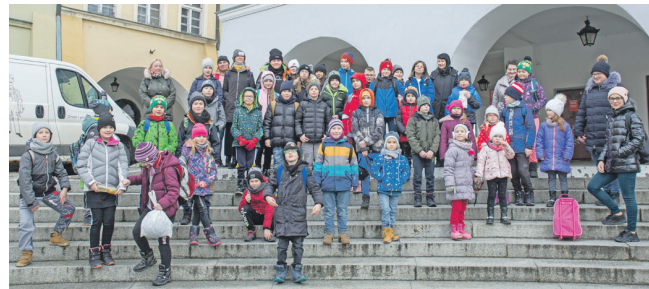
► Jedna z wycieczek