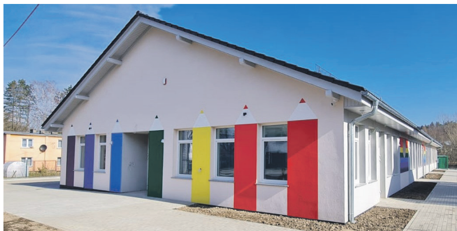
► Elewacja nowego Przedszkola

• Tekst: Hubert Tyndyk / Karolina Laszkiewicz