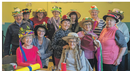
► Przedstawiciele Gminnej Rady Seniorów

Działa aktywnie, skupiając coraz większą rzeszę seniorów. Jesienią ubiegłego roku dzięki funduszom zewnętrznym rozpoczęła realizację swojej autorskiej inicjatywy „Babsko-Męskie pogaduchy czyli Senioralna Grupa Wsparcia”. Przy wsparciu rodzin i przyjaciół zorganizowała cykl 10 spotkań warsztatowych promujących zdrowie seniorów i radość życia. Wszystko pod hasłem: Jak się nie dać..., np. oszukać w różnych sytuacjach życiowych, nudzie i rutynie, czy też manipulacji innych. Rada Seniorów zorganizowała również „Andrzejkowe Bajanie” z barwnym ulicznym korowodem. Do udziału zaproszeni zostali uczniowie klas trzecich janowickiej szkoły, dla których przygotowano wróżby i słodki poczęstunek. Dzieci zrewanżowały się pięknymi życzeniami dla Andrzejów będących w składzie Rady oraz śpiewem.