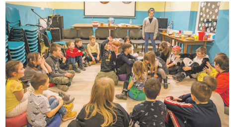
► Zajęcia w świetlicy