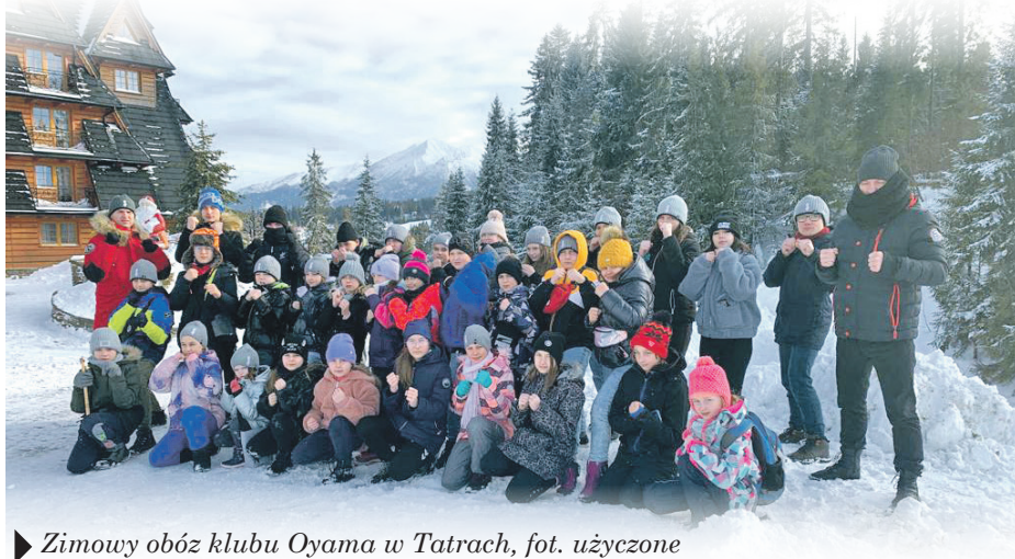
► Zimowy obóz klubu Oyama w Tatrach, fot. użyte