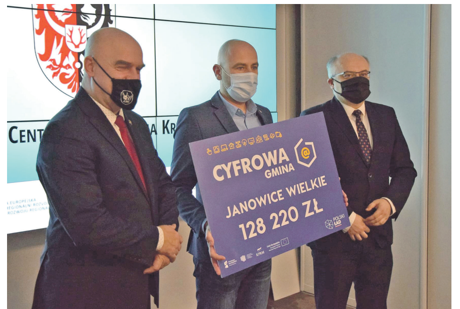
► Wójt Gminy odbierający promesę, fot. użyte