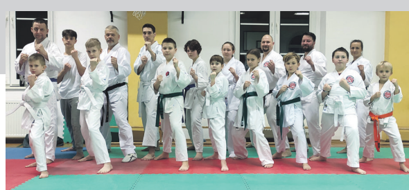
► Stacjonarny obóz klubu Shotokan, fot. użyte

Karkonoski Klub Karate Shotokan zorganizował obóz stacjonarny.