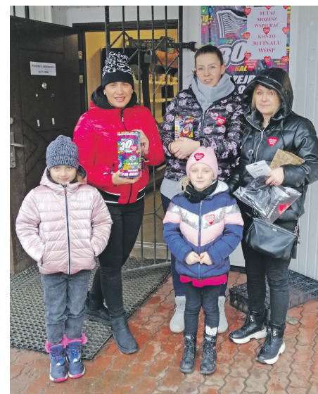
► Wolontariusze WOŚP

Dzięki uprzejmości lokalnych przedsiębiorców można było wrzucać pieniądze do stacjonarnych puszek zlokalizowanych w trzech punktach: w sklepie pp. Szpecht, salonie kosmetycznym p. Kiny oraz sklepie „Na zdrowko” pp. Łoin.