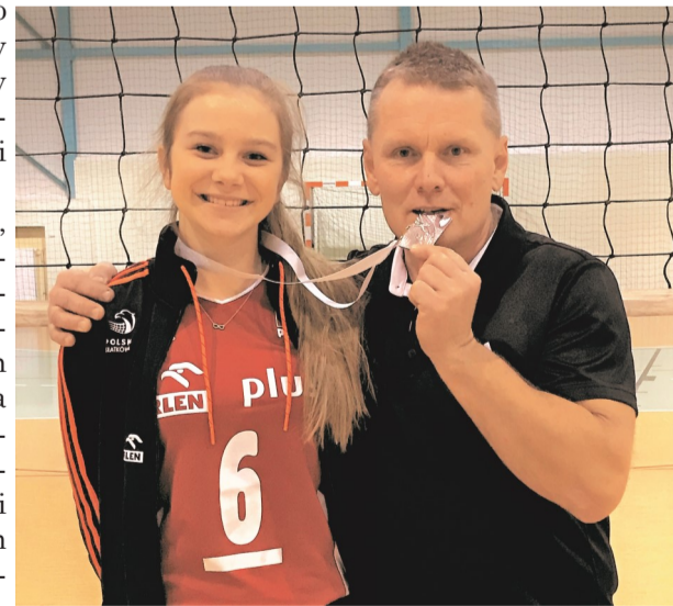
► Asia i pierwszy trener (fot. Z. Chorąży)

cesów. Gratulujemy także pierwszemu trenerowi oraz rodzicom, którzy