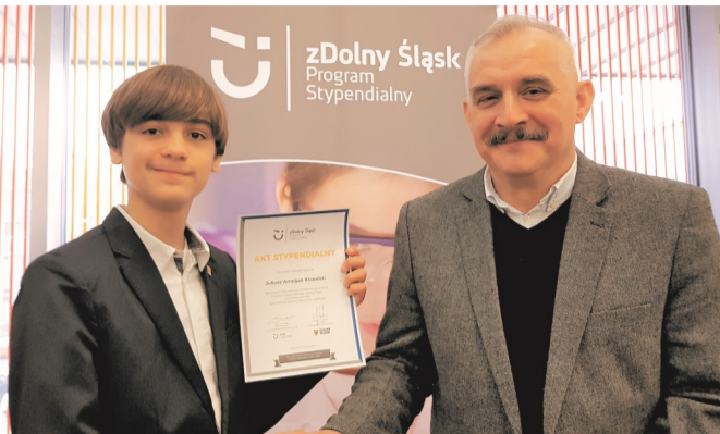
► Doniosła chwila

cyjne, talenty szachowe, angażuje się społecznie i jest dowcipny. Julek zna