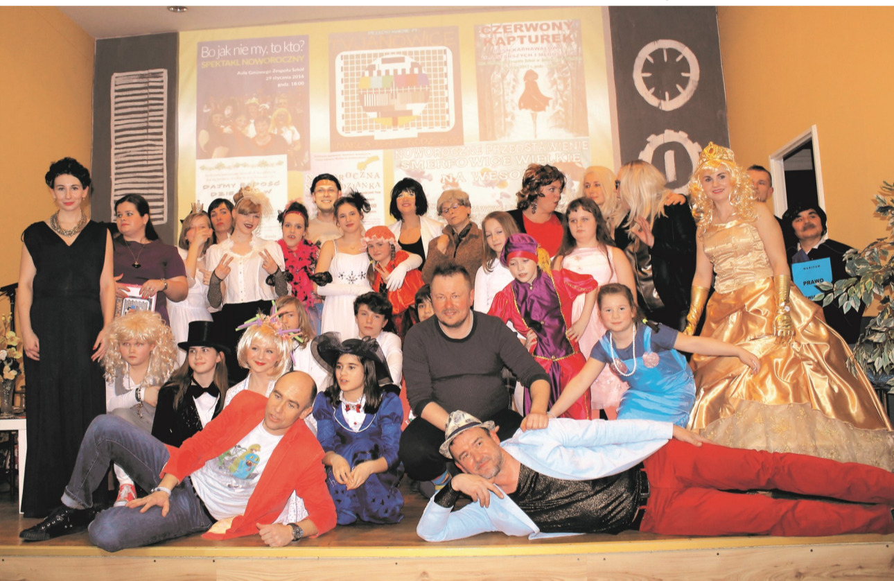
► Gwiazdy janowickiej ramówki

głych edycji przedstawień (blisko 20 tys. zł.) zostały przeznaczone m.in.: na zakup wyposażenia dla przedszkola i szkoły, leczenie i rehabilitację młodego mieszkańca gminy, wsparcie działalności seniorów działających przy świetlicy wiejskiej „Rudawy”.