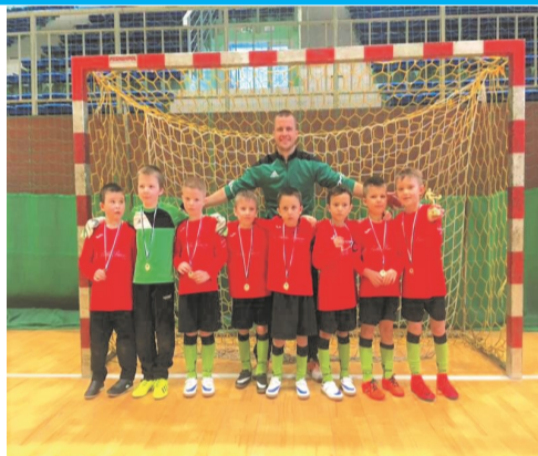
► Młodzi mistrzowie

Podopieczni trenera T. Fijałkowskiego mieli już zapewnione 4 miejsce w turnieju, ale nie osiedli na laurach. Mecz z drużyną Polonia Świdnica przegrali 1-0, a kolejne dwie rozgrywki zwyciężyli osiągając wyniki 3-0 i 2-0. W klasyfikacji generalnej młodzi adepci Janowickiej piłki nożnej stanęli na drugim stopniu podium, ponadto zawodnicy otrzymali wyróżnienia indywidualne - Szymon Ignaczak otrzymał miano najlepszego zawodnika turnieju, Kubę Fijałkowskiego z 6