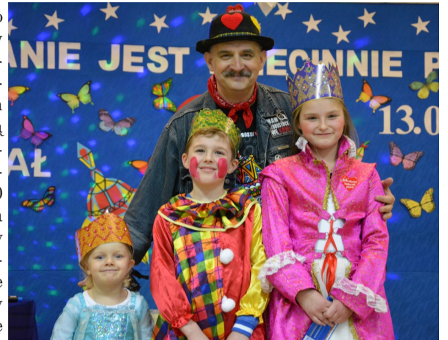
► „Pomaganie jest dziecinnie proste” - tak brzmiało tegoroczne hasło finału WOŚP

tego sukcesu nie wymieniając nazwisk, by kogoś nie pominąć. Dziękuję uczniom kwestującym i pracującym w kawiarence, nauczycielom, opiekunom samorządu, pracownikom administracji i obsługi szkoły, rodzicom przygotowującym kanapki dla kwe-