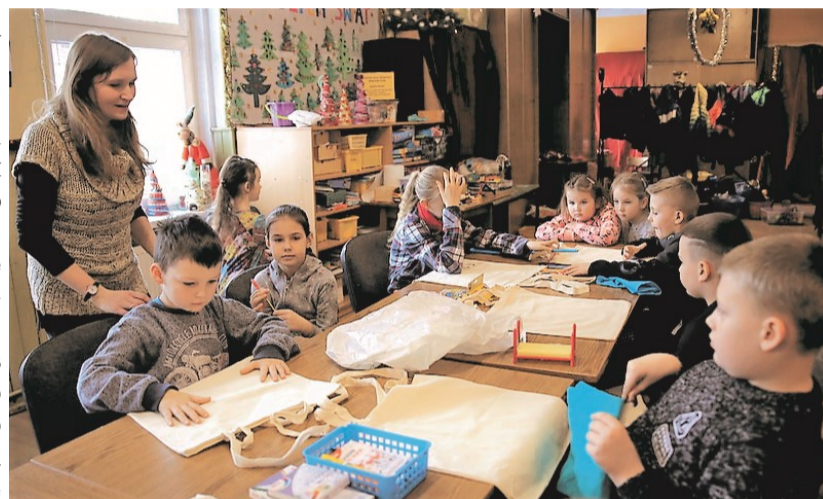
► Warsztaty plastyczne (fot. K. Pisarska)

Świetlica wiejska „Rudawy” zaprasza dzieci (także spoza Janowic) od wtorku