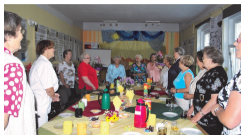
◆ Urodziny senierek

nia papieru czerpanego, kulinarne, zielarskie, komputerowe, fotograficzne. Projekt zostawił w nas -uczestnikach wiele dobrych wspomnień, ale przede wszystkim pomógł nam wyrobić nawyk systematycznych spotkań, któ-