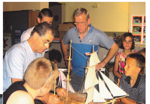
◆ Warsztaty z modelarzami

ry Szalonych Możliwości kilkanaście projektów