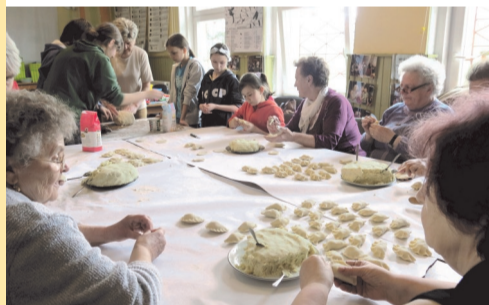
◆ Wspólne lepienie pierogów

24 listopada 2006 roku Fundacja Czarodziejska Góra rozpoczęła w świetlicy realizację projektu „Kalejdoskop umiejętności”, którego celem była m.in. wymiana między dziećmi a seniorami umiejętności - zarówno tych odchodzących w niepa-