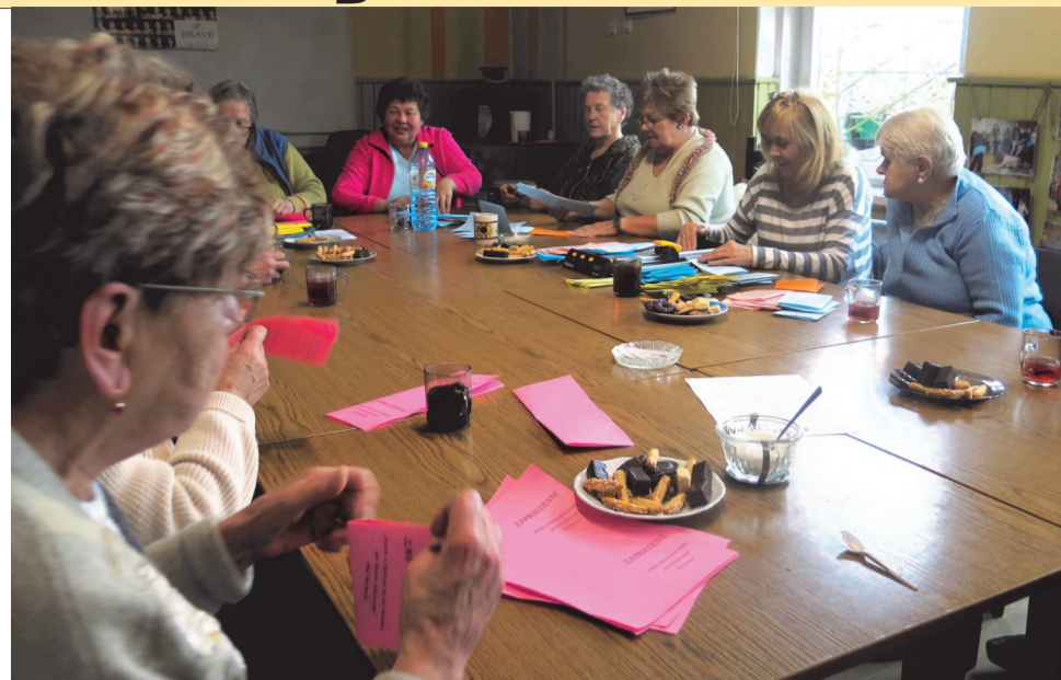
◆ Spotkanie integracyjne

przygotowali tradycyjne w działaniach, za zaangażowanie, pomysły i aktywność przy ich realizacji!” kabaretu „Seniority”, który mogli obejrzeć wszyscy mieszkańcy naszej gminy.