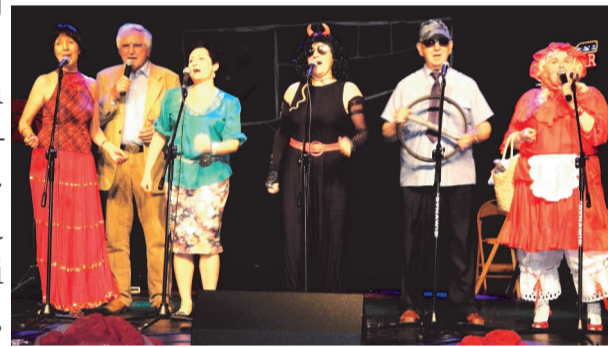
◆ Kabaret Seniority