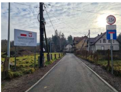
► Ul. Robotnicza po remoncie