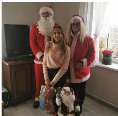
► Odwiedziny Mikołaja

W tym roku Mikołaj miał do rozdania 151 paczek. Dzieci były zaskoczone, a zarazem bardzo zadowolone z odwiedzin Mikołaja, który obdarował je paczkami. Chętnie rozmawiały z Mikołajem, a na ich twarzach pojawił się uśmiech. Mikołaj chętnie pozował do zdjęć i obiecał, że powróci do nich za rok. Mikołaj bardzo dziękuje za miłe i ciepłe przyjęcie oraz za poczęstunek, a dzieciom za piękne laurki. Opiekun świetlicy serdecznie dziękuje za pomoc w zakupie