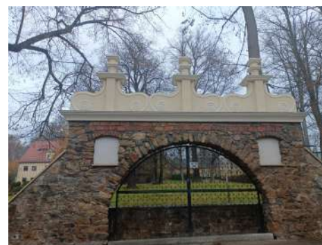
► Zabytkowa brama po remoncie