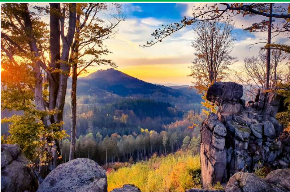
► Jesienny zachód słońca- formacje skalne Rudaw Janowickich

W konkursie wystartowało 10 uczestników, przesyłając łącznie 22 fotografie ukazujące walory krajobrazowe i przyrodnicze Gminy Janowice Wielkie.