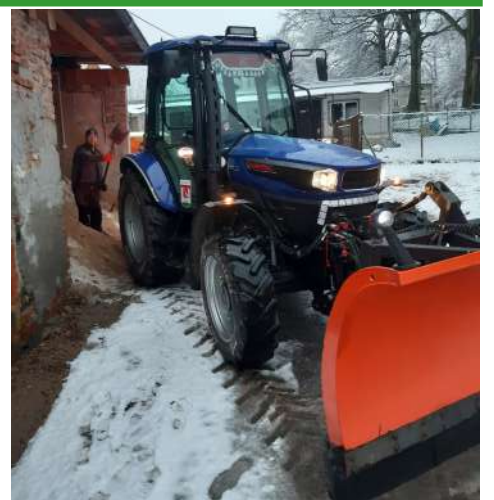
► Pan Błażej przy pracy

Za zimowe utrzymanie dróg gminnych odpowiedzialni będą pracownicy Urzędu Gminy w Janowicach Wielkich. Reklamacje należy zgłaszać do Urzędu