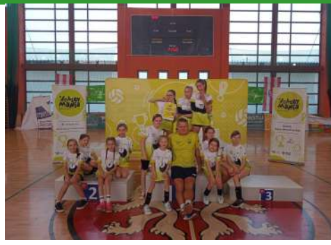
► Zwycięska drużyna

Turniej został rozegrany w hali sportowej w Kątach Wrocławskich. Dziewczęta z klas piątych ponownie pokazały, że są w dolnośląskiej czołówce, stając po raz kolejny na najwyższym stopniu po-