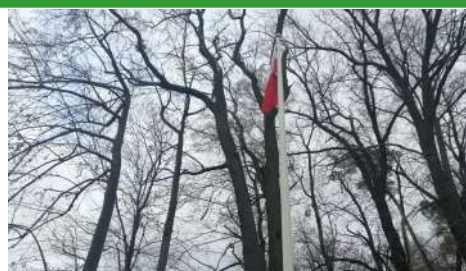
► Maszt flagowy