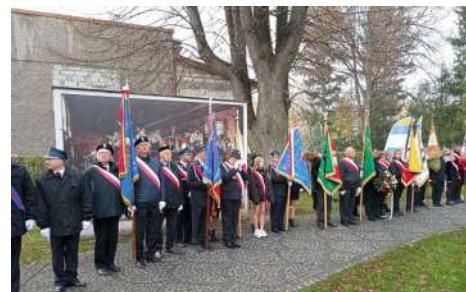
► Obchody 11 Listopada