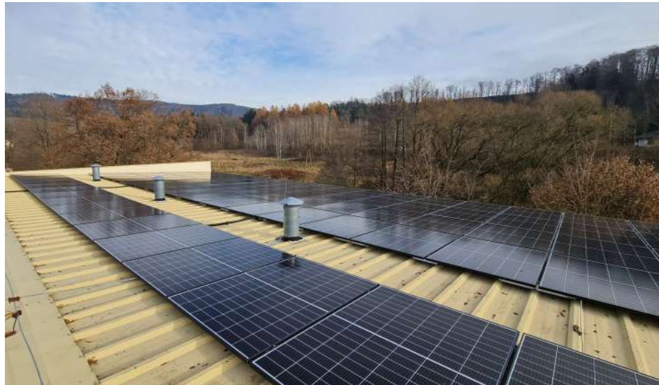
► Instalacja fotowoltaiczna na dachu hali sportowej