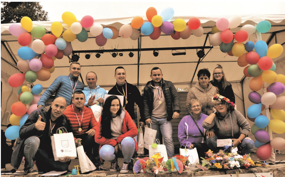
► Uczestnicy jednej z janowiankowych zabaw

go udziału w zabawie. Po emocjonujących występach przyszła pora nagrodzić uczestników konkursu na najładniejszy wianek. Rywalizacja odbywała się kategoriach: mieszkańcy i ugrupowania. Komisja złożona z Sołtysów po raz kolejny musiała dokonać ciężkiego wyboru. W kategorii mieszkańców przyznano 3 nagrody, a wśród ugrupowań zwyciężyła świetlica z Komarna - jedyna biorąca udział w konkursie.