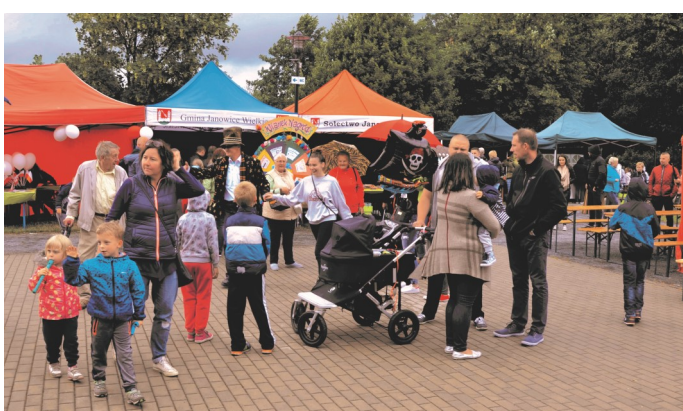
► Goście imprezy

wodnym. Przekazali wiele ciekawostek, m.in. w jaki sposób nurek porozumiewa się