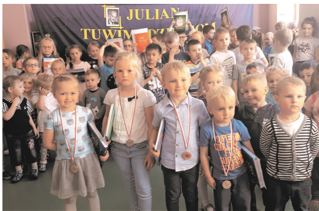
► Zdolne maluchy

i staranna wymowa, kultura słowa, intonacja i ogólny wyraz artystyczny. Recytatorskie zmagania rozpoczęła najmłodsza grupa - 3 i 4 latki. Ośmiornic odważnych ujęło słuchaczy świetną znajomością tekstu, a co niektórzy nawet ruchem scenicznym. Nie obyło się oczywiście bez delikatnej tremy, ale w jej zwalczeniu pomagały panie nauczycielki dodając otuchy i śmiałości, a czasem podpowiadając fragmen-