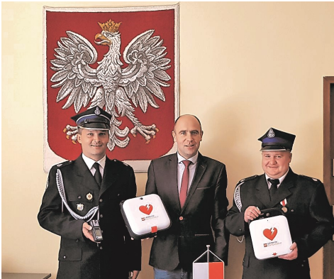
►Przekazanie nowego sprzętu