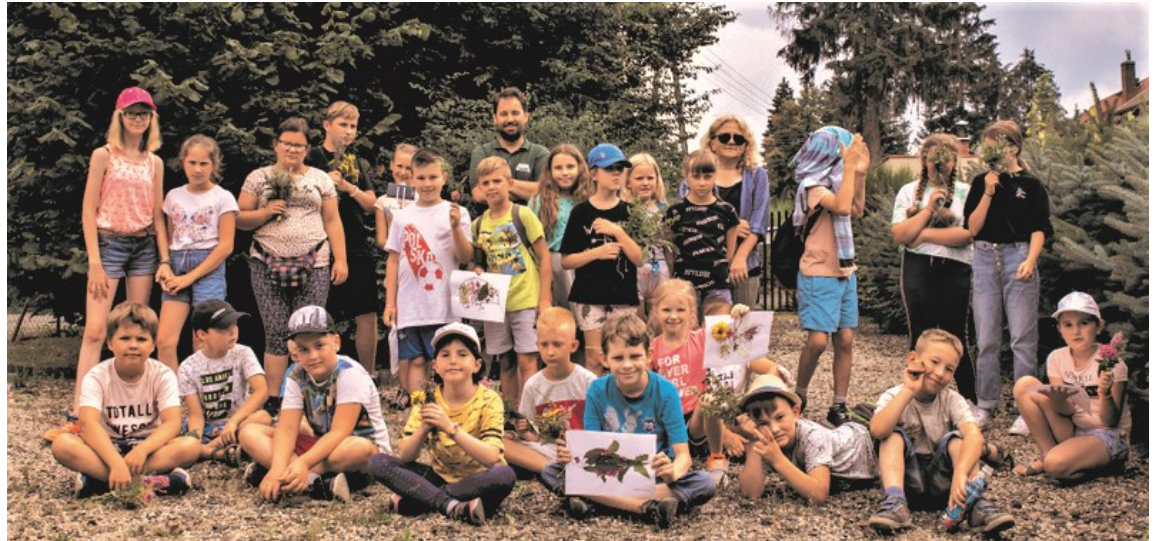
► Uczestnicy wakacyjnych zajęć

nej „Salamandra” w Myśliborzu, z licznymi ciekawymi warsztatami oraz wycieczką do pobliskiego Jawora i zwiedzaniem Kościoła Pokoju. Sierpień przebiegał pod znakiem survivalu. Dwukrotnie – na początku i pod koniec miesiąca, odbyły się pięciodniowe półkolonie, podczas których dzieci i młodzież zdobywały rozmaite umiejętności przydatne w terenie, podczas wędrówek. Pierwsze zajęcia survivalowe poprowadziła ekipa podróżników z firmy „Dzika Droga”, drugie – survivalowcy z fun-