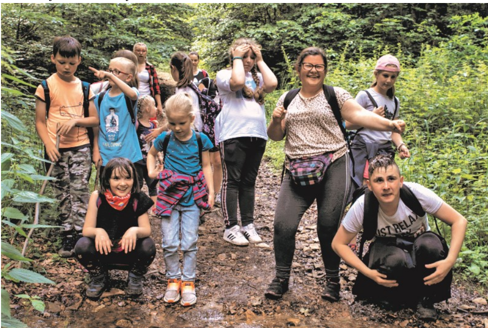
► Na leśnym szlaku