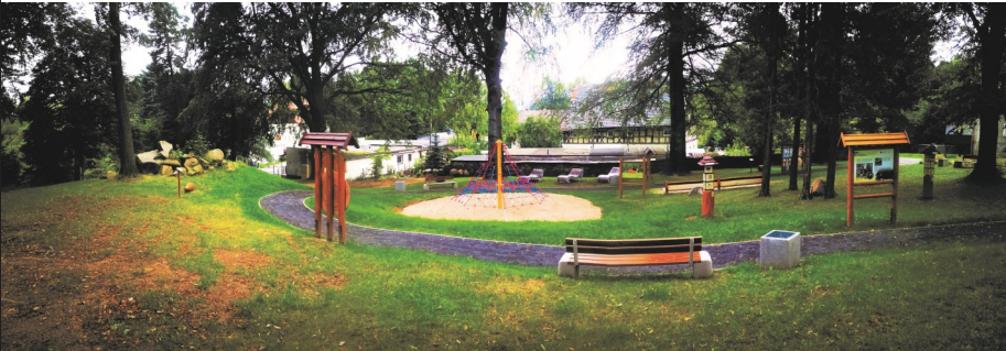
► Idealne miejsce do zabawy i odpoczynku

Projekt „Budowa ścieżki edukacyjno-ekologicznej pn. Rudawski Las” został zrealizowany przy pomocy Ochotniczej Straży Pożarnej w Janowicach Wielkich, za pośrednic-