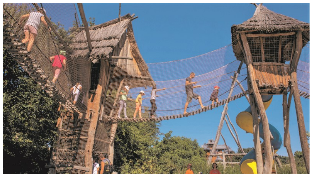
► Zabawy na wysokości

Przez wakacyjne miesiące systematycznie odbywały się w świetlicy warsztaty wokalne w ramach projektu „Piosenka jest dobra na wszystko”