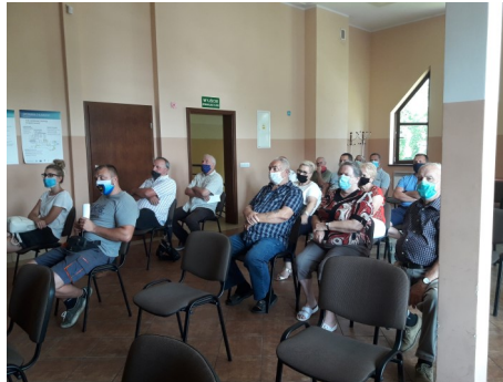
► Uczestnicy spotkania

wanego przez wyżej wspomnianą fundację. W trakcie jego trwania mieszkańcy mieli możliwość przedstawienia swojej wizji MPZP oraz zadania pytań urbarńście opar-