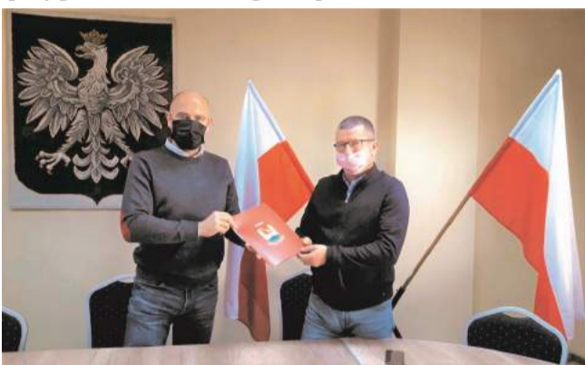
► Umowa podpisana

Gmina przekazała plac budowy wykonawcy, który w Janowicach Wielkich przygotował harmonogram prac.