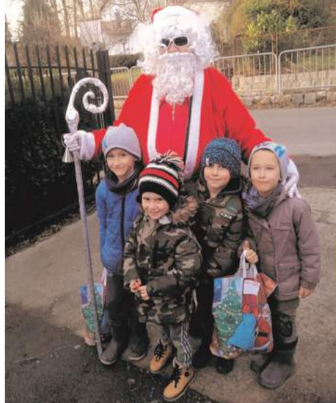
►Zadowolone maluchy