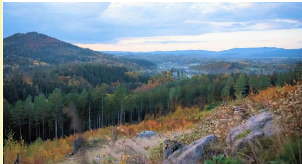
► Skalna Grzęda