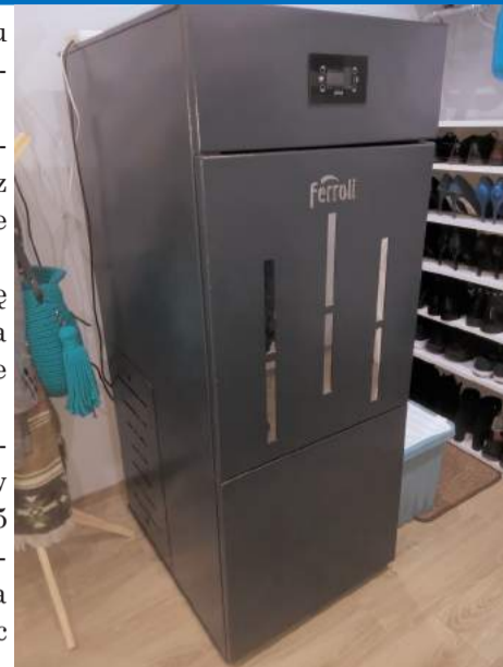
► Urządzenie na pellet

Spośród wszystkich wniosków aż 10 pochodzi z Janowic Wielkich, 3 z Trzcieska, 1 z Komarna i 1 z Radomierza. Kolejna edycja programu gminnego planowana jest w przyszłym roku. Zachęcamy do udziału,