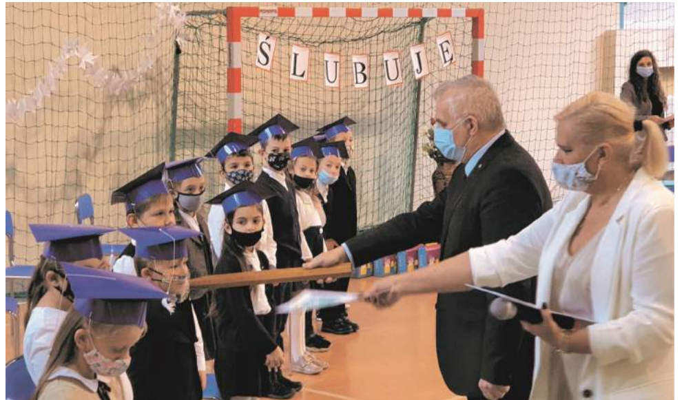
► Świeżo upieczeni uczniowie

Uroczystość rozpoczęła się wprowadzeniem pocztu sztandarowego. Następnie odśpiewany został hymn i głos zabrał Dyrektor Szkoły, witając zebranych, szczególnie grupę 32 pierwszoklasistów, którzy chwilę później stali się oficjalnie uczniami. Mimo panującej pandemii dzieci przygotowały krótki program artystyczny. Następnie odbyło się ślubowanie i symboliczne pasowanie ołówkiem. Miłymi chwilami były: przywitanie