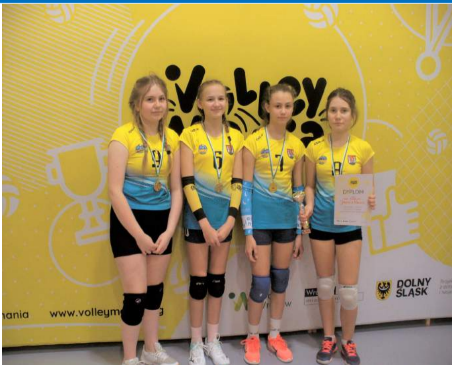
► Złote medalistki