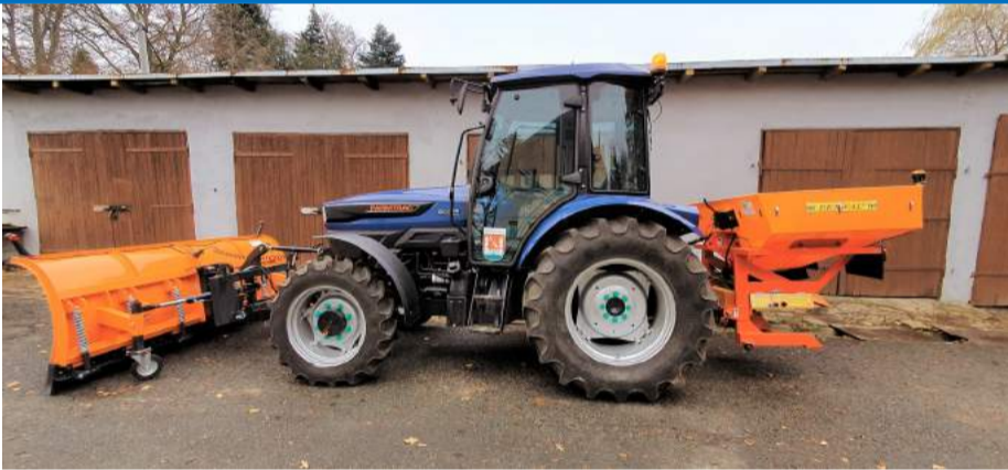
► Nowa maszyna wraz z osprzętem

Całość zestawu to koszt ok. 158 tys. zł. pochodzących z budżetu gminy. Jak piszemy na 1. stronie obsługę odśnieżania dróg gminnych prowadzą pracownicy Urzędu Gminy.