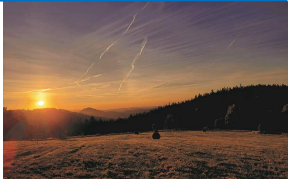
► Zachód słońca w Mniszkowie

Ich autorzy zostali nagrodzeni pakietami gadżetów złożonymi m.in. z: przewodników i map turystycznych, gry memory, kubków i toreb.