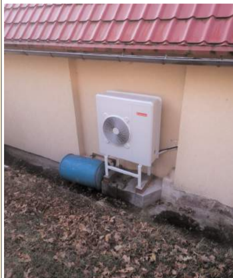
► Pompa ciepła

Z ainteresowanie mieszkańców było większe niż się spodziewano. W tegorocznej, drugiej edycji programu gminnego złożono 15 wniosków na łączną kwotę 59,8 tys. zł.